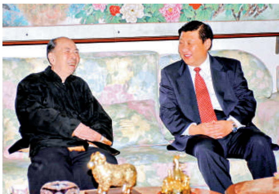
▲習近平05年在澳門看望馬萬祺

晚年時，馬萬祺在2006年中風，北京特遣醫療專家到澳門參與搶救，及後將他送往北京解放軍301醫院救治，此後他一直在北京養病。在今年1月現任全國政協主席俞正聲曾到醫院探望馬萬祺，當時馬萬祺精神不錯。