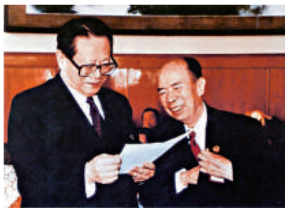
▲江澤民與馬萬祺親切交談