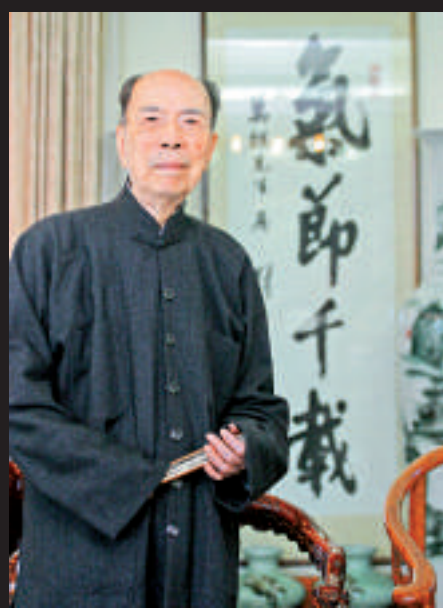
▲馬萬祺於北京病逝，享年95歲 資料圖片