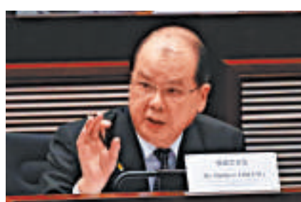
▲張建宗表示，低津計劃鼓勵就業，自力更生

公民黨郭家麒表示，經濟環境差時，較難找工作，設定192小時就如「罰佢（指申請人）」，在「最有需要時就擺佢命」。加上有些家庭的兒童有特殊教育