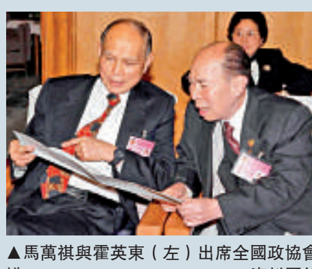
▲馬萬祺與霍英東（左）出席全國政協會議 資料圖片