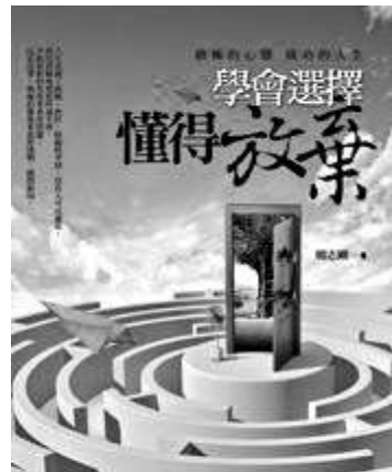
《學會選擇，懂得放棄》 作者：唐汶 出版年份：2008年2月