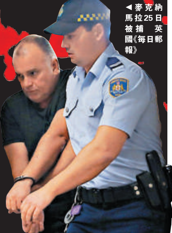
◀麥克納馬拉25日被捕 英國《每日郵報》

73歲的羅傑森是澳洲警隊裡最臭名昭著的黑警察之一，他黑白兩道通吃，曾私下召集會議力圖擺平兩派敵對黑幫之間的火併。他曾擊斃一名毒販，但聲稱是出於自衛。他曾被指控多項重罪，包括販毒和謀殺警方臥底探員，但多數被開脫罪名，最終僅被以串謀妨礙司法公正等較輕的罪名判坐牢3年。他的故事曾被ABC電視台拍成系列片。