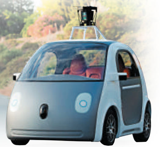
▲谷歌無人駕駛自動原型車

布林在美國科技博客Re/code舉辦的大會上指出，谷歌與汽車製造商合作，計劃打造100至200輛附加安全功能的無人駕駛自動原型車，可以按照接收的地址指令來接送乘客。