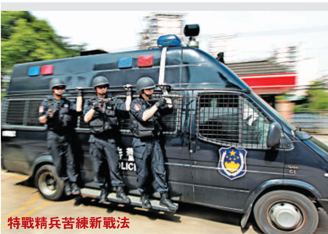
特戰精兵苦練新戰法

國信辦有關負責人指出，微信等移動即時通信服務用戶突破8億，已成為廣大網民溝通交流的重要平台和獲取信息的重要入口但一些人借助這一平台向公眾發布不良或違法有害信息。此次專項行動，重點整治移動即時通信工具的公眾平台等公眾信息發布服務環節，特別是具有傳播和社會動員功能的公眾帳號。嚴厲打擊移動即時通信公眾信息領域傳播謠言、暴力、恐怖、欺詐、色情信息等違法違規行為。嚴厲打擊境內外敵對勢力對我的滲透破壞活動。對不認真履行管理責任的企業依法追究責任。