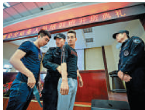
▲烏魯木齊BRT公司招募百名安檢員接受特警培訓

【大公報訊】據人民網北京二十八日消息：針對一份27、28日在網絡與朋友圈多次傳播的「新疆喀什等地將關閉互聯網」的假通知文件，新疆喀什地委對外宣傳辦公室官方微博28日發消息表示，該通知為造假文件，破綻太多。