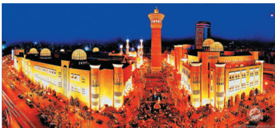
▲近期新疆劃撥專項資金，為每位到新疆的遊客提供500元獎勵，同時也請遊客放心安全保障問題。圖為烏魯木齊國際大巴紮夜景

伊那木·乃斯爾丁表示，為了讓新疆旅行更加物超所值，新疆正在呼籲相關部門盡快批准將哈薩克斯坦等周邊8個毗鄰國家發展成為中國公民旅遊目的地，同時加快口岸建設，發展邊境旅遊。