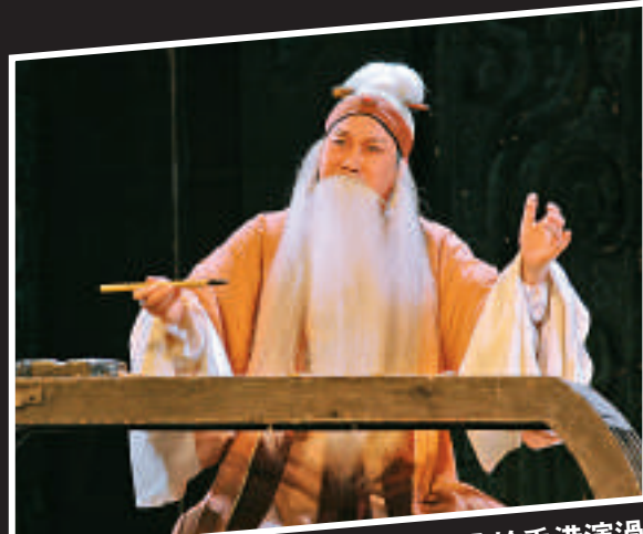
▲豫劇《程嬰救孤》曾於香港演過