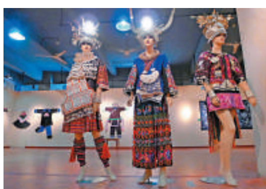
▲三尊塑膠模特展示了貴州特色少數民族服飾

黔東南少數民族以熱情歌聲酒拉開了展覽的序幕。進入展覽，最引人注目的是各種造型精美的貴州銀飾。黔東南州民族博物館館長羅春寒告訴記者，苗銀分頭飾、頸飾、胸飾、首飾、盛裝飾和童帽飾等，銀飾以大為美，以重為美，以多為美。 此外，在少數民族家庭裡，女兒出嫁的服飾行頭是嫁妝的重要組成部分，由母親、女兒負責準備。由於嫁衣的造型設計、刺繡等都是純手工製作，不少家庭從女兒出生之日起就開始為嫁妝做準備。 展覽內，塑膠模特身上展示苗族婦女的盛裝服飾，據羅春寒介紹，模特身上的全套行頭佩戴下來，最重可達三十多斤。 該展覽將展至本月十五日。