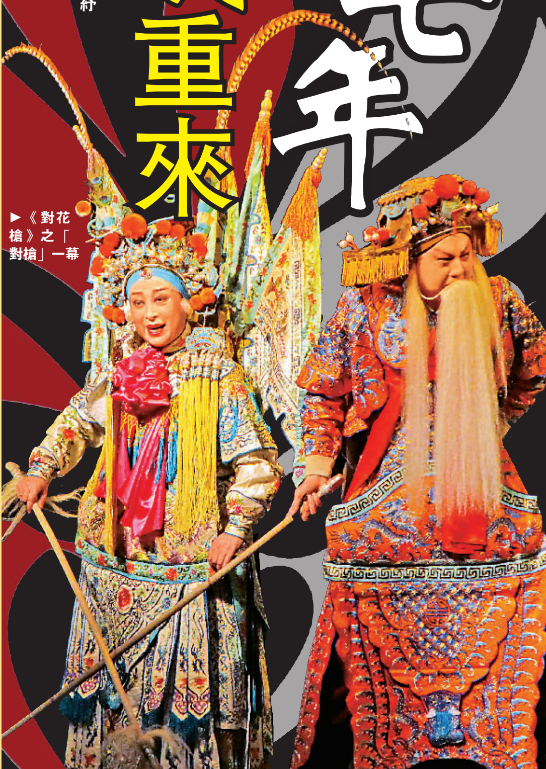
▲《對花槍》之「對槍」一幕