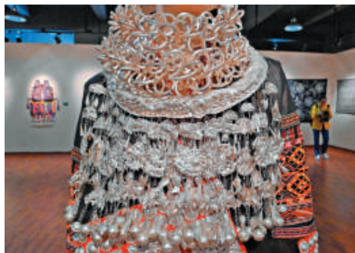
▲貴州銀飾中的精美頭飾

【大公報訊】記者蔣煌基泉州報導：「霓裳銀裝——貴州少數民族服飾展」正在福建省泉州市華僑歷史博物館舉行。本次展覽展出黔東南苗族、侗族、土家族等少數民族服飾近兩百件，包括享譽中外的貴州蠟染、刺繡、佩飾等富有民族特色的服飾、配件。從古老原始的貫首服、琵琶衣到紋飾繁縟的開襟衣、圓領衣，到千姿百態的長裙、中裙、短裙，以及精美的銀飾、頭飾，造型裝飾豐富多彩，工藝技術巧奪天工。