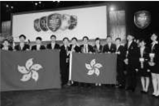
▲香港代表隊於頒獎典禮後一同拍照留念，共同分享喜悅

安全，更方便。正如「英特爾國際科學與工程大獎賽」的宗旨「Inspired to Change the World」一樣，我也一直相信和堅持「創意可以改變人類」，而能夠幫助人類，改善生活，才是我們做科研應該持有的態度。而這次香港代表隊的優異成績，再一次反映了我們科創中心的科普教育工作正朝着一個正確的方向發展。我在這裡要再一次感謝一直以來對我們作出支持的機構和團體，感謝香港特區政府教育局對本中心的支持；還有支持我們工作的學校，老師和同學們。希望香港來年有學生成為「世界第一」！