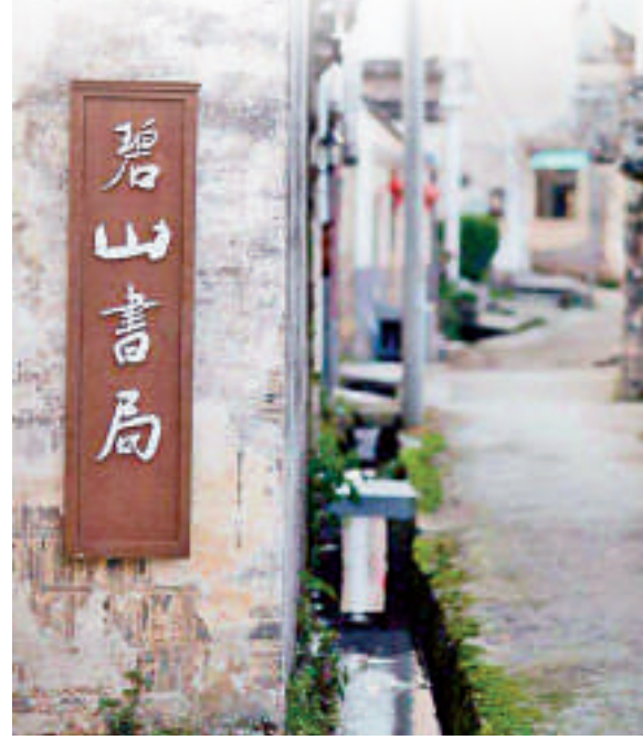
▲黟縣古祠堂變身南京先鋒碧山書局

上述老房子命運的變遷，離不開當地政府對接市場，以認養、認租、認購、認領等方式，合理有序地對古民居、古建築進行保護與利用開發，誕生出藝術會所、民俗客棧、特色酒吧等12類產業方面的業態和文化教育、衛生福利、民俗活動等7類事業方面的業態。 再者，並非所有人均可享受徽宅投資商機。黃山市古建築的招商引資突出引強擇優，前提是符合文物保護相關法律法規和專項利用規劃。項目招商原則是區縣一級審核，重大項目招商要報黃山市政府研究。此外，對於投資者亦有基本要求，即有文化修養，並且熱愛徽派建築。