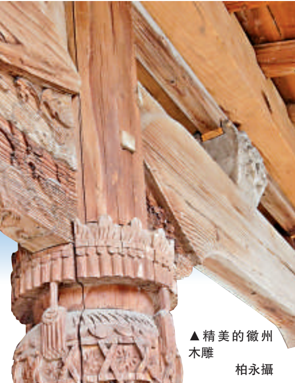
▲精美的徽州木雕

此外，黃山市建立古建築保護利用項目庫，選取三陽、萬安、歷溪等10個物質和物質文化遺產相對集中豐富的古村落，包裝成徽州文化生態保護區文化空間保護利用試點項目。