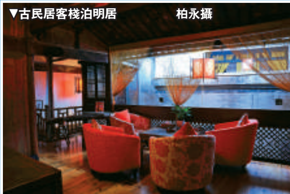
▼古民居客棧泊明居

「一生痴絕處，無夢到徽州」。安徽省黃山市近期全面啟動徽州古建築保護利用工程，對其境內16類3474處古建築建立數據庫掛牌保護，以期未來依舊可以「望得見山、看得見水，記得住鄉愁」。作為安徽省20個農村綜合改革試點縣之一，黟縣首期選取30幢古民居開展宅基地轉讓試點，以期探索建立古民居產權流轉機制。目前，相關試點方案正在修改完善，最快本月可付諸實施。 大公報記者 柏永