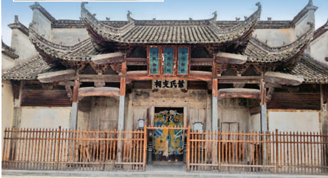
▲中國影視村南屏村曾是張藝謀導演電影作品《菊豆》的外景拍攝地

「一生痴絕處，無夢到徽州」。安徽省黃山市近期全面啟動徽州古建築保護利用工程，對其境內16類3474處古建築建立數據庫掛牌保護，以期未來依舊可以「望得見山、看得見水，記得住鄉愁」。作為安徽省20個農村綜合改革試點縣之一，黟縣首期選取30幢古民居開展宅基地轉讓試點，以期探索建立古民居產權流轉機制。目前，相關試點方案正在修改完善，最快本月可付諸實施。 大公報記者 柏永