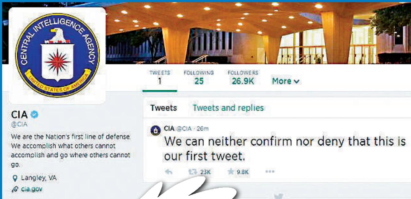
◀ CIA在推特上發的第一則推文

【大公報訊】綜合法新社、英國《每日郵報》6日消息：一貫形象神秘的美國中央情報局（CIA），甚少跟大眾公開接觸。這個部門終於跟上潮流，首次正式推出官方推特（Twitter）和臉譜（Facebook）帳號，但第一則推文依然保持神秘，還帶有一絲幽默感。