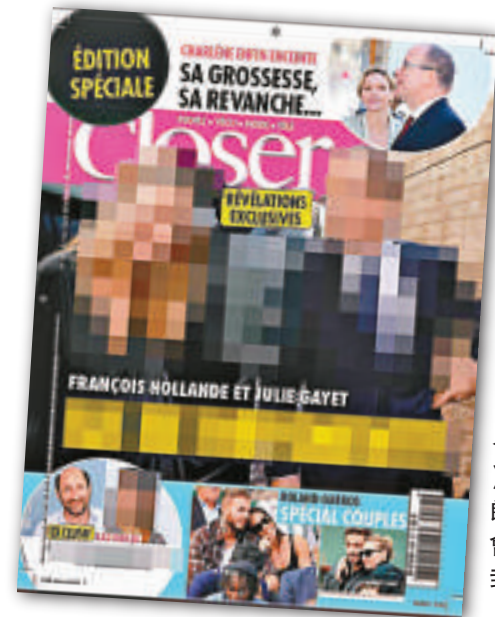
◀法國《Closer》雜誌揭秘奧朗德與嘉葉幽會的新一期封面

位於沙特吉達的王國大廈，是樓高一千米的摩天大樓，將於4年之後落成。大廈內會裝設65部升降機和扶手電梯，其中7部就是芬蘭公司Kone出產的超快升降機。Kone公司的總裁保證，這種高速升降機不會出現