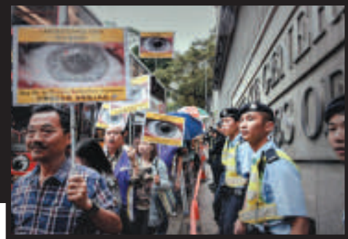
▲去年六月，斯諾登的支持者在美駐港總領館外示威 資料圖片