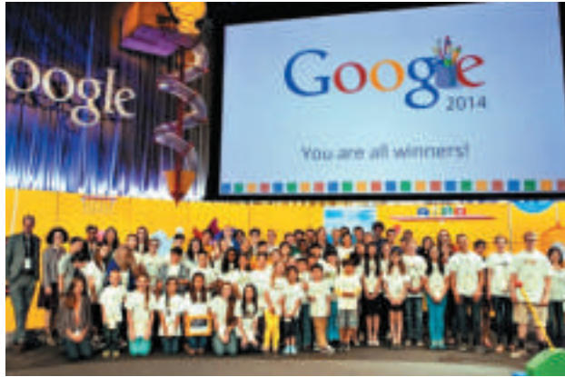
▲有超過10萬人參與了此次塗鴉大賽