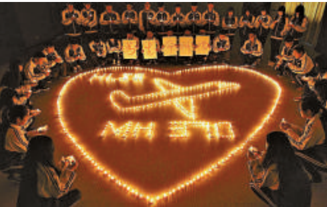
▲3月10日，浙江某學校學生為MH370祈禱，該航班失聯至今已3個月 資料圖片

雖然普遍認為，這架波音777飛機墜毀在南印度洋，但至今為止大規模的國際搜尋工作仍然毫無進展，沒有發現任何飛機殘骸或者任何有關飛機的信息。