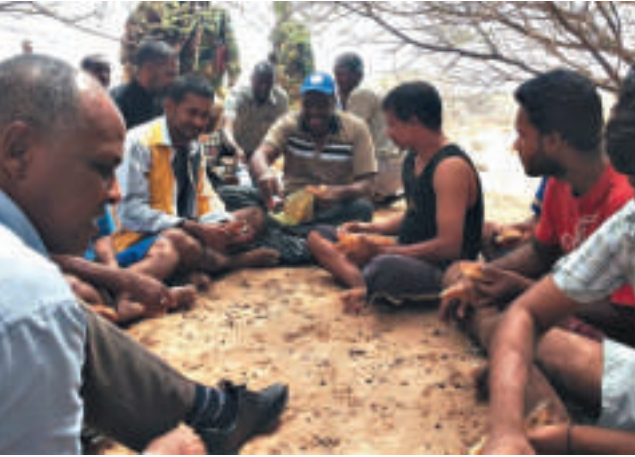
▲11名遭索馬里海盜挾持近4年的水手終獲釋 英國《每日電訊報》

11人服務的貨輪、掛馬來西亞旗的「阿爾貝多號」2010年11月從阿聯酋駛往肯尼亞途中，於索馬里外海1500公里海域遭海盜挾持。加穆杜格自治區內政首長哈桑表示，救援行動未支付贖金。