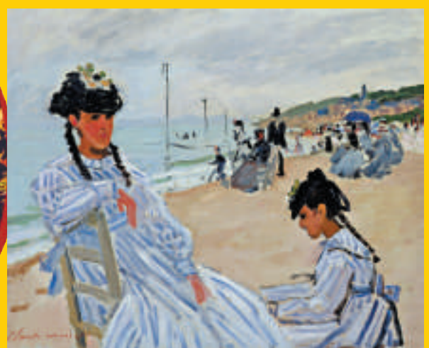
▲莫奈畫作《在特魯維爾海邊》（一八七〇年，油畫布）