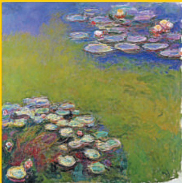
▲莫奈畫作《睡蓮》（一九一四至一九一七年，油畫布）