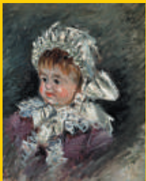
▲莫奈畫作《米歇爾·莫奈畫像，嬰兒時期》（一八七八至一八九九年，油畫布，米歇爾是莫奈小兒子）