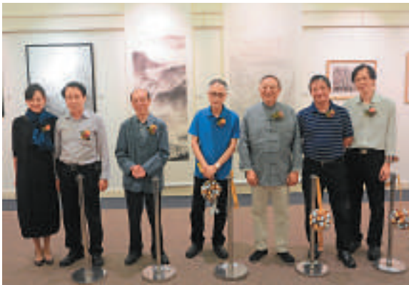
▲開幕禮嘉賓與藝術家合影