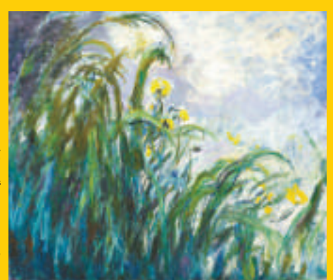
►莫奈畫作《黃色鳶尾花》（一九二四至一九二五年，油畫布）