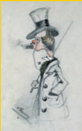
▲莫奈漫畫《抽雪茄的花花公子》（一八五七年，黑色鉛筆，水粉）