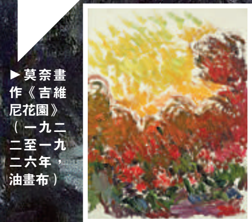
►莫奈畫作《吉維尼花園》（一九二一至一九二六年，油畫布）

更為難得的是，除了繪畫作品，三件莫奈生前使用過的貼身生活物品：眼鏡、煙斗、調色板也走出博物館來到中國。經過百年滄桑仍能保存完好如新，時光彷彿就在這一刻靜止。 品味莫奈勵志人生 在展廳另一角，幾幅諷刺漫畫作品吸引了記者注意。主辦方介紹，這也是展覽的特別之處。舉世皆知莫奈是印象派大師，卻不知大師的藝術道路起自漫畫。莫奈少年時期所熱衷的並非中規中矩的素描，而是以誇張但取其神似的諷刺漫畫肖像，十五歲時就因諷刺漫畫聞名整個哈弗港，他為自己作品開出的價格是每幅二十法郎，自此開啓了藝術旅程。莫奈的啟蒙老師布丹曾評價他的漫畫：「他們是有趣、巧妙而漂亮的，一看就知道，很有才華。」這次來到上海的三幅莫奈早期諷刺漫畫作品：《小龐特翁德·阿特爾》、《西奧多·佩羅蓋》、《波爾多紅酒》可以讓人一窺大師早年的筆跡。 值得一提的是，印象派剛誕生之際，社會的不理解形成了幾乎瘋狂的輿論壓力。印象派創新的畫風並沒有馬上被世俗接受，作品被官方沙龍回絕，屢屢遭到評論家奚落，也直接造成了莫奈經濟上的窘迫。但在這樣的境況下，莫奈仍然堅持自我，憑藉頑強的毅力依然繼續創作。雖然常年貧困且創作環境異常艱苦，莫奈依然堅持走出畫室，在大自然中寫生，捕捉光影變換中的景物，最終將印象派發揚光大，為世人所接受。儘管晚年眼睛患白內障、幾近失明，但仍然不輟地繪畫，直到邁向最輝煌的藝術成就。因此，來觀賞此次展覽，除了領略大師非凡創作意境，也能從莫奈的勵志人生獲得新的啟示。 該展覽即日起至本月十五日於上海K11購物藝術中心B3層展出。