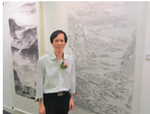
▲熊海鍾情以「濃、淡、乾、濕、焦」表現水墨畫的層次和意境