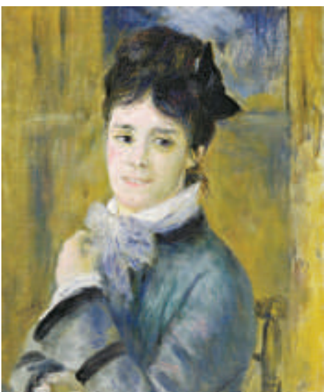
▲雷諾阿畫作《克勞德·莫奈夫人畫像》（一八七二年，油畫布）

由巴黎馬丹莫奈美術館、上海天協文化發展有限公司和K11 Art Foundation聯合主辦、上海市對外文化交流協會特別支持的「印象派大師·莫奈特展」近日在上海掀起一股印象派熱。本次展覽也是「中法建交五十周年」重要慶典活動之一，展出五十五件作品，包括四十幅莫奈真跡、十二幅其他印象派畫家大師作品，以及一些莫奈生前所用物品。法國巴黎馬丹莫奈美術館是目前全世界典藏莫奈作品最多最豐富的美術館之一，藏品全部是來自於莫奈兒子米歇爾的捐贈。 莫奈是公認的印象派先驅，少年時已是小有名氣的諷刺漫畫家。在中晚年時期，莫奈花費四十年時間在吉維尼的花園生活與創作，並以花園中的睡蓮、百子蓮、垂柳與日本橋，畫出一系列為世人所景仰的傳奇之作。 五主題全面了解莫奈 莫奈對於中國觀眾來說並不陌生。以往他的單幅作品也會在上海展出，但大師作品的專題展覽還不多見。主辦方介紹，本次展覽全部展品的保額總價值高達六億歐元。為了幫助觀眾更好地了解莫奈，展覽被劃分成五個主題：莫奈的漫畫、莫奈的旅行、莫奈的花園、莫奈的晚年、莫奈的朋友。其中有極其罕見的莫奈少年時代的諷刺漫畫，和莫奈生前極具代表性的幾個系列作品。 莫奈的一生雖然基本圍繞塞納河畔、吉維尼兩地居住，但熱愛大自然的總會通過旅行挑戰新的題材。這次的展品就有莫奈旅行中的作品如《倫敦國會大廈》、《挪威柯爾薩斯橋》、《布維爾海難》等畫作。除了在外探風，莫奈最喜歡的主題就是花園。從一八八三年起，他住在吉維尼，成為一位「園林藝術家」。他恣意賞花養花，親手造就了一個絕妙的「水上花園」，也藉花園系列作品迎來創作高峰。本次展出的《小船》、《紫藤花》、《睡蓮》、《黃色鳶尾花》等都是「花園系列」代表作。 巨幅畫作也是本次展覽的亮點。莫奈在巨幅畫作上頗費心血，創作過程也異常艱辛。本次展覽難得推出四幅莫奈巨型畫作：三米長的紫藤花、一米五高的荳草、超過兩米的睡蓮和兩米高百子蓮，懸掛在展廳頗有震撼效果。