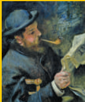
▲雷諾阿畫作《閱讀中的克勞德·莫奈》（一八七二年，油畫布）