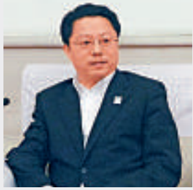
▲江蘇省委常委、南京市委書記楊衛澤

【大公報記者陳曼南京九日電】2014年南京青奧會進入倒計時。江蘇省委常委、南京市委書記、南京青奧組委會執行主席楊衛澤近日在接受全國200多家媒體的總編和記者代表採訪時表示，青奧會籌備工作已進入賽時運行階段。他說，南京將辦出富有中國特色的奧林匹克運動會，為世界青少年辦一場化繭成蝶的「成人禮」。楊衛澤還邀請全球青年及其家人來南京，感受六朝古都風采，共同分享青春盛會。