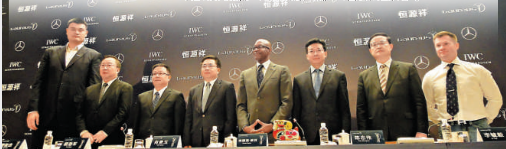
▲摩西（左五）在新聞發布會上宣布2015年勞倫斯世界體育獎頒獎典禮將在中國上海舉行，左一為姚明

俄羅斯前體操名將涅莫夫和中國前籃球巨星姚明今天出席了新聞發布會，會上姚明表示，「2003年獲得勞倫斯最佳新人獎時，我因為正在參加比賽，沒能到現場去領獎。（勞倫斯頒獎典禮）跟體育比賽一樣，只有在現場經歷後，才能真正感受這一盛典的魅力。我非常期待勞倫斯獎明年在我的家鄉上海舉辦。」