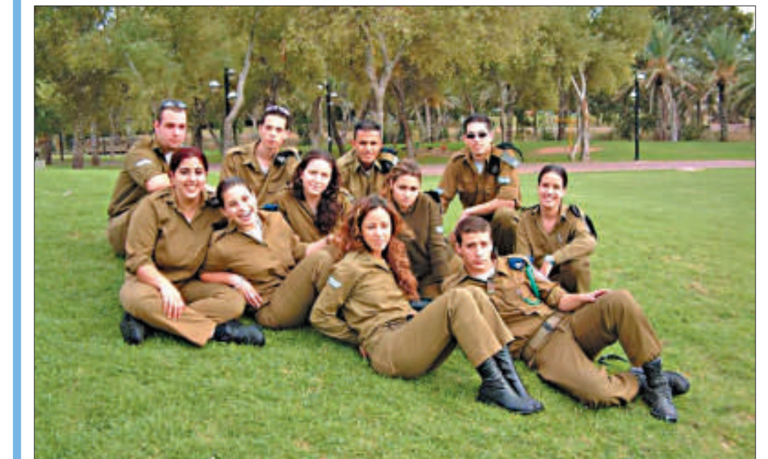
以色列青年軍人 (資料圖片)

以色列軍隊是一支常勝軍隊，但在軍事教學中從不誇耀自己的輝煌戰績，而是把不成功的典型戰例拿出來分析研究，教育學員引以爲戒，舉一反三。如一九七三年十月的第四次中東戰爭，由於戰前以軍情報有誤，判斷失準，因而放鬆警惕，在是否對阿拉伯國家實行先發制人的打擊這個問題上猶豫不決，結果在戰爭初期陷入被動，以軍稱爲不可逾越的巴列夫防線被埃及軍隊突破，戈蘭高地也在佔壓倒優勢的敘利亞軍隊的猛攻下岌岌可危。以軍把分析研究上述戰例作爲軍事教學中的一項重要內容，不斷對這些沉痛的歷史教訓進行總結，以教育全軍懂得「前事不忘，後事之師」的道理，引發軍人的創新思維，爲打好下一場戰爭做好準備。