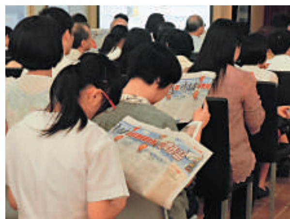
▲第三屆「《讀書樂》學生隨筆比賽」將於七月初公布結果

《讀書樂》將於六月下旬選出上述各獎項得主，並將各獎項郵寄予各協辦單位，學校及得獎者。