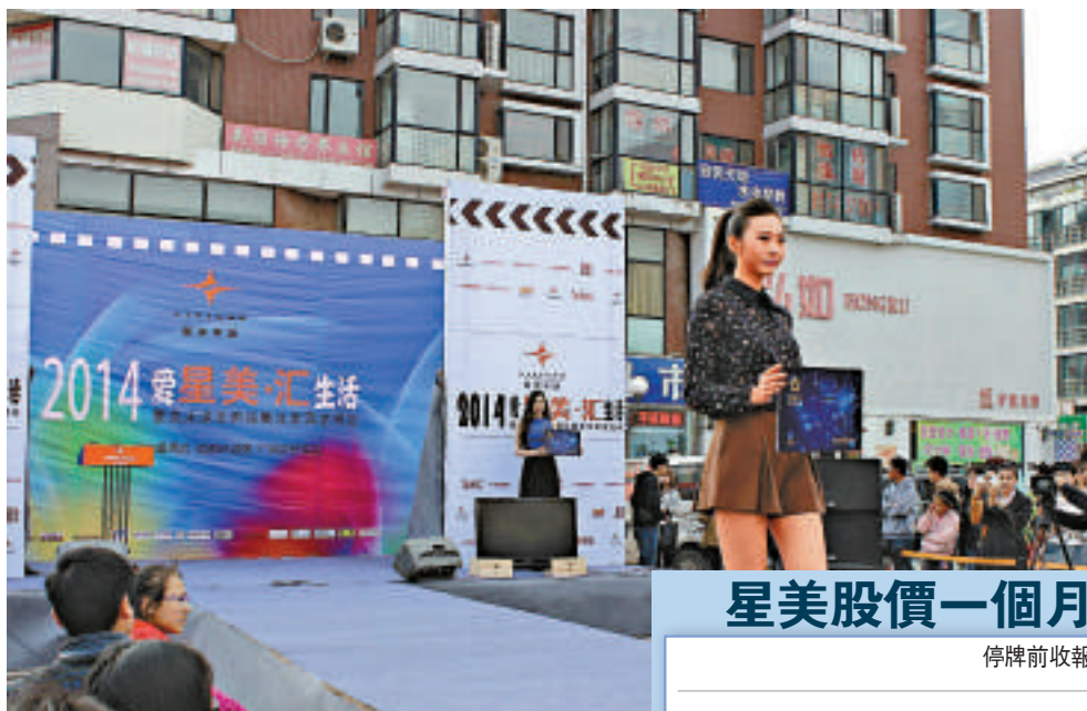
騰訊傳透過旗下投資基金入股星美文化。圖為星美文化電影宣傳活動。

市場人士認為，騰訊看中星美文化的主要原因，是該公司近年所出品的電影實座，例如《中國合夥人》，去年在內地取得5.39億元人民幣票房，絕對有利騰訊開拓內地移動互聯網影視產業新市場。