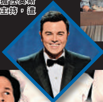
▷麥費蘭擔任奧斯卡頒獎禮主持,遭受批評