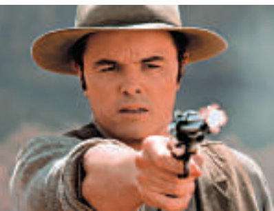
△麥費蘭粉墨主演《奪命西》片中阿拔一角