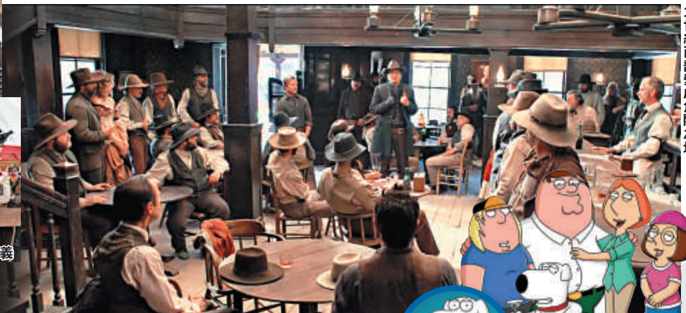
◀《奪命西》把浪漫的地九世紀西部變成危險之地