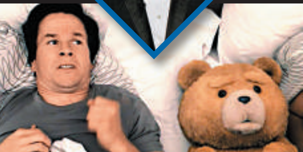
▲麥費蘭一鳴驚人之作《賤熊30》