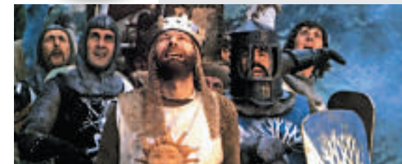
▲「踏低噴飯」的經典喜劇《聖杯騎士》諷刺英國圓桌武士傳說