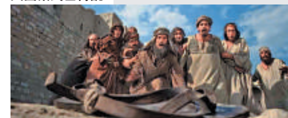
▲嘲諷聖經故事,「踏低噴飯」名作《萬世魔星》