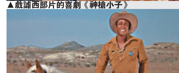
▲《神槍小子》以黑人來飾演西部城鎮的警長