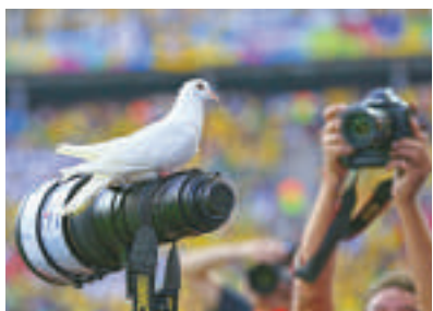
▲開幕式上的一隻和平鴿停在攝影機上

巴西世界杯開幕式的籌備工作在今年3月展開。綵排時間接近100個小時，大會舉辦了總共31次試鏡，來挑選表演的演出者。然而，英國廣播公司（BBC）就表示「雖然我們都不是專業的編舞師和音樂人，但這個的確糟糕太無聊了……」《每日郵報》用「一堆跳舞的樹們」來形容開幕式。