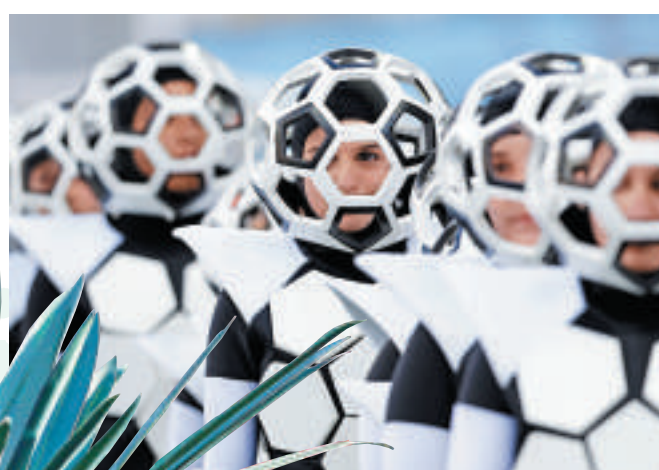
▲舞蹈演員12日打扮成足球在開幕式上表演