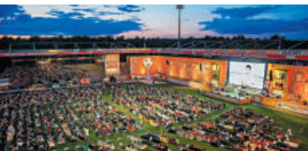
▲德國球迷12日把沙發搬到球場組成「最大客廳」觀賽

在周四晚的比賽，共有12000球迷一起觀賽，為了營造出客廳的效果，主辦方還在大熒幕周圍貼了約3500平方米的牆紙，不過這場活動還有一個關鍵問題無法解決：那就是要由誰來控制遙控器。