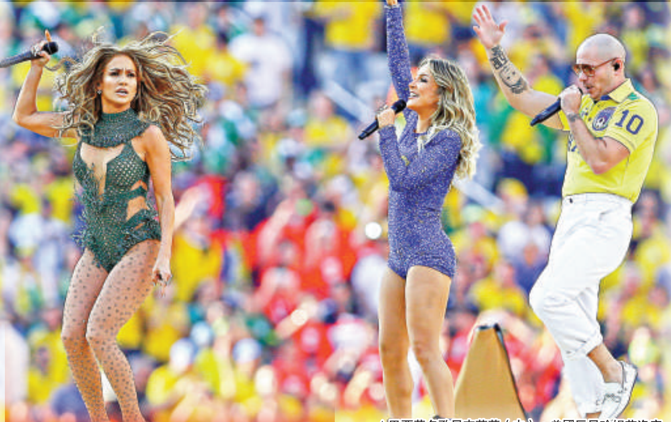
▲巴西著名歌星克萊蒂（中），美國巨星珍妮花洛底絲（左一）和說唱歌手Pitbull在開幕式上唱響主題曲