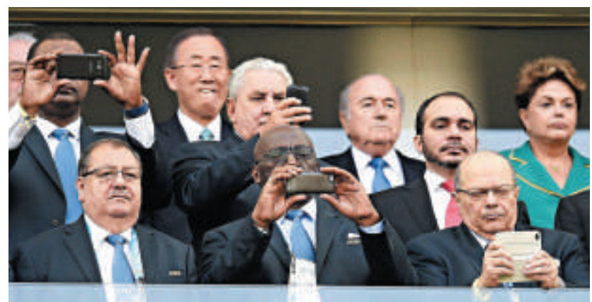
▲巴西總統羅塞夫（後排右一）與FIFA主席白禮達（後排右二）12日在開幕式上被噓