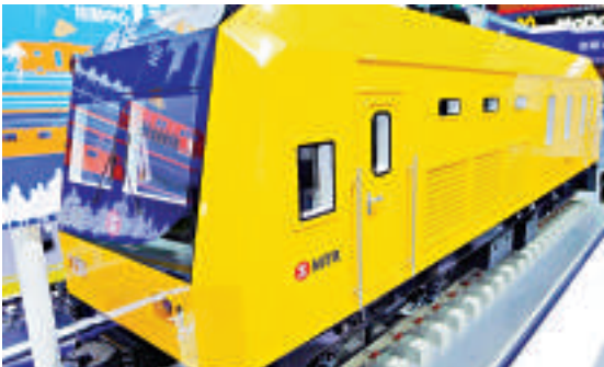
▲中國南車製造的港鐵鋼軌探傷車模型17日亮相上海軌道交通展

發展局發言人表示，2007年的估算是因應當時初步設計概念所得，隨通脹及建築成本上升，去年價格估算已升至33億元，而大樓設計不斷完善，加入更多符合市民需要的設施，強調口岸的設計平實，但以人為本。