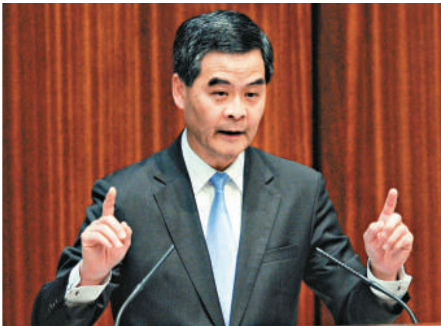
▲梁振英強調，政府不會撤回有關撥款申請，計劃亦不可能不遷不拆，表示政府一定會盡量照顧市民搬遷的需要

另外，對於反對派要求押後撥款申請，政府發言人昨夜發表聲明，強調為了整體社會及市民利益，政府實在無法同意，亦不能押後撥款，而撥款申請完全符合議會的議事程序。至於大型發展項目的具體詳情，則仍有商議空間。當局亦會於撥款批准後繼續與受影響的居民、商戶及農戶保持溝通。政府發言人強調，議員不應因部分人士的激烈行動而拖延撥款申請的議決，同時希望議員通過撥款。