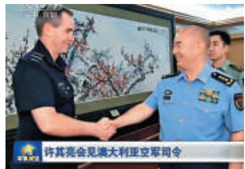
中央軍委副主席許其亮十七日會見來訪的澳洲空軍司令布明。

【大公報實習記者江哲北京十七日電】中美光伏產品貿易摩擦餘溫未消，近日，歐盟太陽能行業協會又宣稱中國太陽能電池板製造商「嚴重違反」中歐去年達成的光伏解決方案。對此商務部回應稱，中歐光伏價格協議來之不易，中方反對任何別有用心借助媒體大肆抹黑中國企業的行爲。商務部並重申此前美國對中國光伏產品發起「雙反」調查是對貿易救濟措施的濫用。