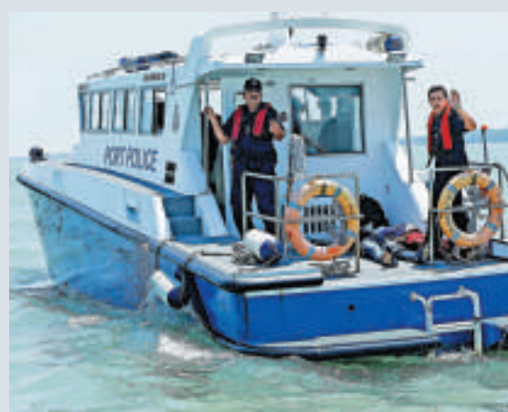
▲馬來西亞水警18日將印尼遇難者的屍體運回雪蘭莪的一個港口

幾年來，非法移民偷渡大馬的問題越來越嚴重，估計馬來西亞人口約2900萬，其中約200萬人是非法移民，尤以印尼偷渡客最多，而許多偷渡客在大馬的棕櫚種植園區討生活。