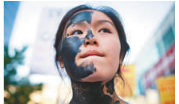
▲一名加拿大少女17日塗上黑色污漬反油管項目