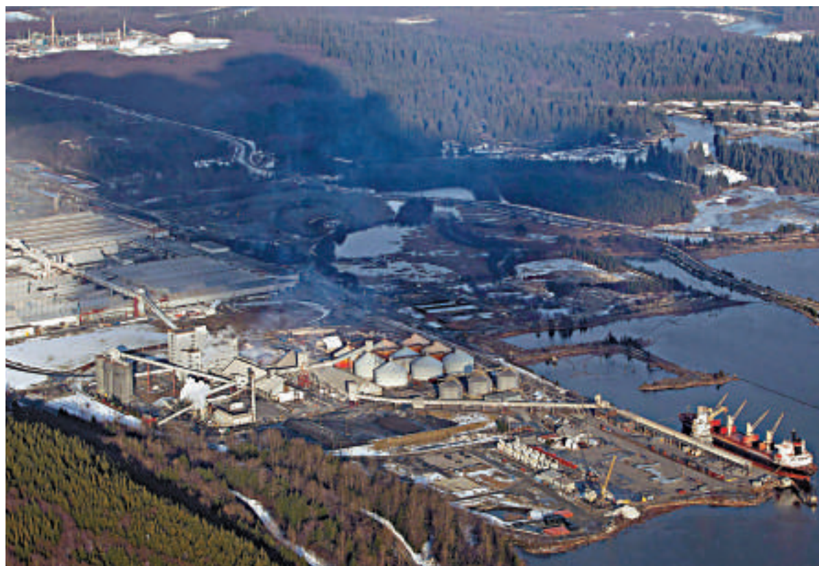
▲加拿大計劃興建的「北方門戶」油管終點基蒂馬特港

加拿大天然資源部長瑞克福特發布聲明說，政府接受獨立評估小組建議，通過「北方門戶」油管的方案。聲明中說，評估小組附帶209項條件，要求油管興建方必須遵守，以降低油管興建對環境的影響。