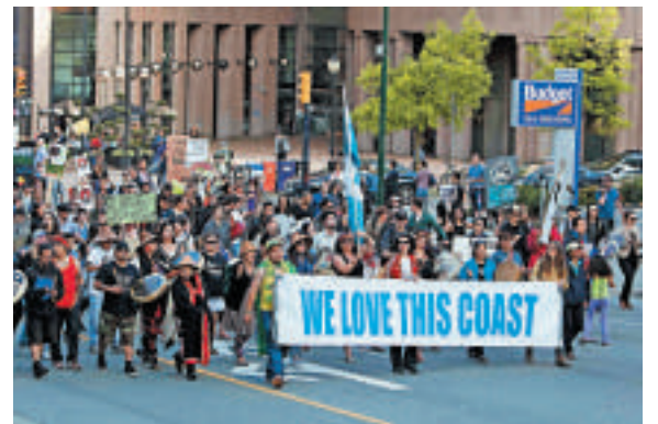
▲加拿大溫哥華民眾17日示威，抗議興建「北方門戶」油管