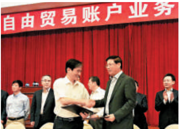
▲央行上海總部和上金所簽署合作備忘錄，後者將其自貿區內推出的國際黃金業務結算納入 FT 帳戶體系

【大公報記者倪巍晨上海十八日電】中國央行上海總部和上海黃金交易所（上金所）簽署合作備忘錄，上金所將其自貿區內推出的國際黃金業務結算納入自由貿易（FT）帳戶體系。上金所理事長許羅德透露，黃金國際板目前籌備工作進展順利，上海黃金國際交易中心已完成註冊，相關業務規則也已基本修訂完畢，計劃年內推出黃金國際板業務。