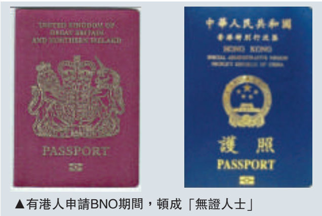
▲有港人申請BNO期間，頓成「無證人士」

入境處發言人表示，處理特區護照申請，收齊所需文件、費用及相片後，一般需時10個工作天，11歲以下而未領有香港永久性居民身份證的兒童一般需14個工作天。此外，處理郵遞、投遞或網上遞交申請的時間，可能需要額外2至3個工作天，因遺失、損壞或更改個人資料而換領護照的人士，須親身遞交申請，其申請亦需較長時間處理。發言人強調，入境處只會在理由充分的情況下，才接納緊急簽發香港特區護照的要求，通常不會為方便觀光旅遊而緊急簽發香港特區護照。發言人亦提醒，有意出國留學的人士，應預留足夠時間申請所需旅行證件和簽證。