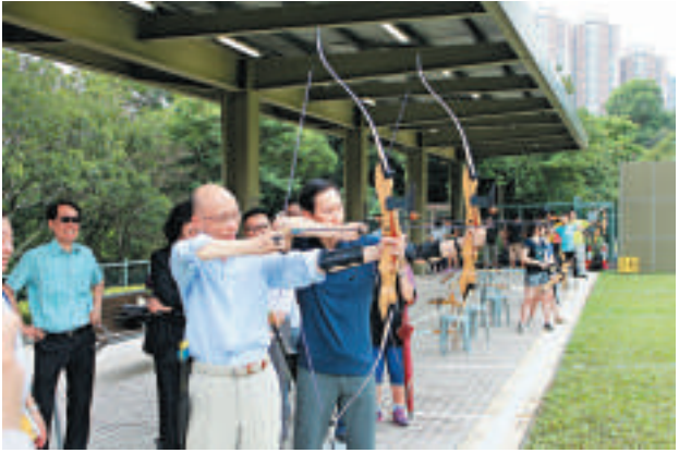
▲黃錦星、陳智思視察牛池灣公園射箭場

【大公報訊】記者吳卓峰報道：對於《施政報告》建議斥資10億元，活化已修復堆填區，環境局局長黃錦星表示，最快今年底接受非牟利組織，申請在7幅已修復堆填區地皮，發展康樂及環保設施，強調地皮只能作最高兩層的低密度建築。他又坦言，立法會財委會正就新界東北撥款議題「拉布」，擔心「三堆一爐」及民生基建撥款，同樣受到影響，冀議會運作能盡快重拾正軌。