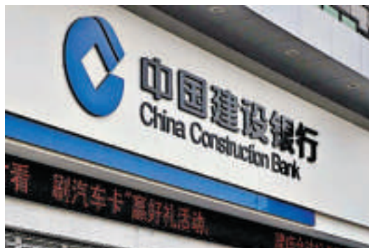
▲建行透過旗下建行亞洲，昨日在瑞士發行人民幣債券，是次為瑞士首隻人債

外電《路透》引述消息指，建行(00939)透過旗下建行亞洲，昨日在瑞士發行人民幣債券，是次為瑞士首隻人債，亦是蘇黎世尋求成為人民幣離岸交易中心的新舉措。