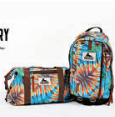
▲新秀麗收購一家美國從事背包、登山、越野跑產品及配件供應商Gregory，現金代價8500萬美元

新秀麗今年憑藉人氣韓劇《來自星星的你》，並邀來劇中男主角金秀賢擔任代言人，令其品牌及產品紅極。公司近月借勢不斷作收購，今年4月先以2000萬美元收購法國行李箱品牌Lipault，到上月收購個人電子設備纖薄保護殼公司Speck Products，到現時收購美國老牌戶外背包品牌Gregory，公司規模迅速擴大，惟兩家收購公司的產品與其本業風馬牛不相及，公司發展方向令人期待。