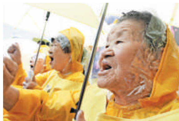
▲2009年8月15日，前韓國「慰安婦」在首爾的日本大使館前示威