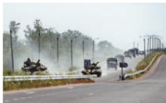
▲烏克蘭親俄武裝的卡車和坦克9日開赴頓涅茨克

這項協議的簽署，將為烏克蘭成為歐盟會員國鋪平道路。已經下台的烏克蘭前總統亞努科維奇去年拒絕簽署此一協議，從而引發延續至今的烏克蘭國內亂局。