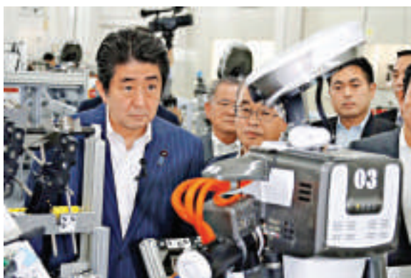
▲日本首相安倍晉三（左）19日在東京郊區參觀一家工廠