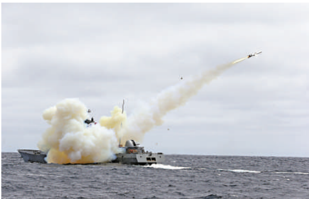
▲韓國20日在獨島附近海域實行艦對艦導彈射擊演習

韓國海軍從當地時間從上午9時47分開始演習，地點在慶尚北道蔚珍郡竹邊港以東50公里海面，共有韓國「廣開土大王」級驅逐艦等19艘水上艦艇和2架改良型P-3CK海上巡邏機等參加演習。