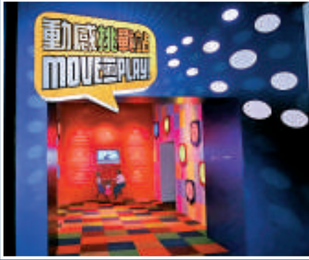
▲「動感挑戰站」展區 本報攝 ▲展區的「熱能攝影機」 本報攝