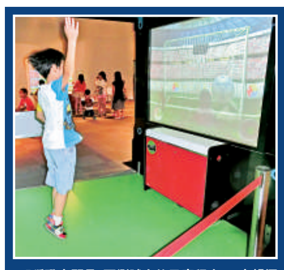
▲「稱職守門員」可測試人的反應程度