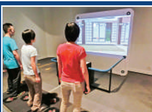
▲重現經典「跳舞機」遊戲

是次的展覽遊戲的活動量大，建議市民穿着運動鞋。展覽由康樂及文化事務署主辦，並由芬蘭科技中心Heureka製作及提供展品。有關展覽詳情可瀏覽香港科學館網站，或電二七三二二二二查詢。