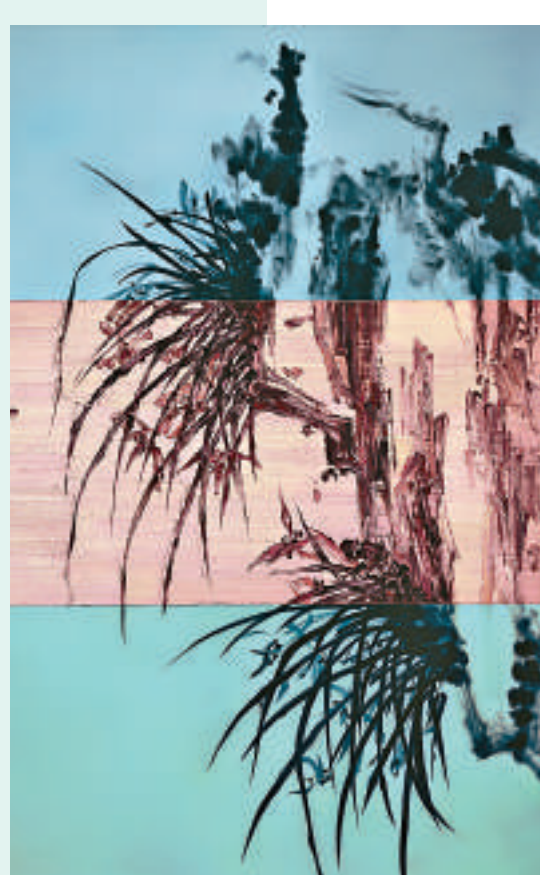
▲《岩石上的蘭花》，布面油彩