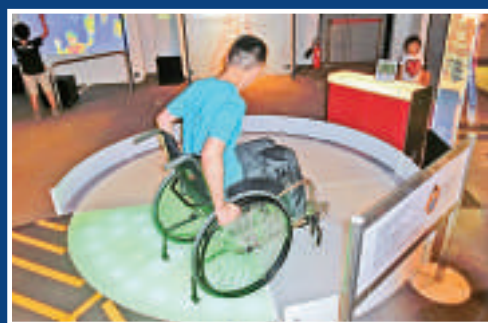
▲「韻律甜甜圈」也適合傷殘人士參與