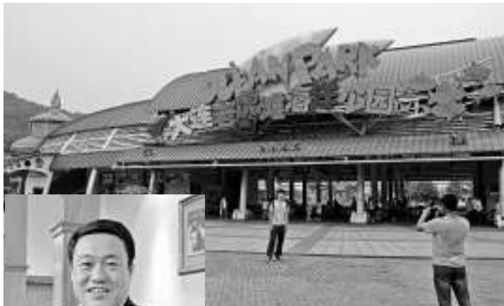
▲海昌正與大連老虎獅商討進一步加強及拓展合作範圍，料下月中會有進展

前公司負債率約76%，若計及上海和三亞新項目的貸款，料至2016年初會增至100%，重申仍低於同行的180%至240%。他續說，公司每年資本開支約為年收入的7%，其中5%為增加軟性項目，如更換節目等；另有2%為日常維修費用。