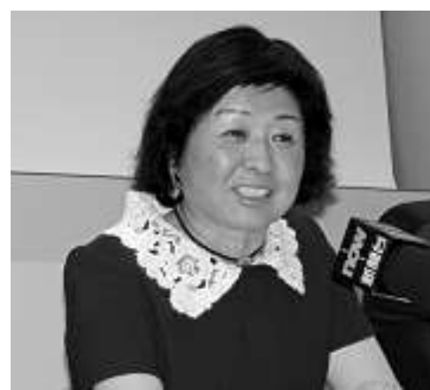
▲玖龍紙業董事長張茵