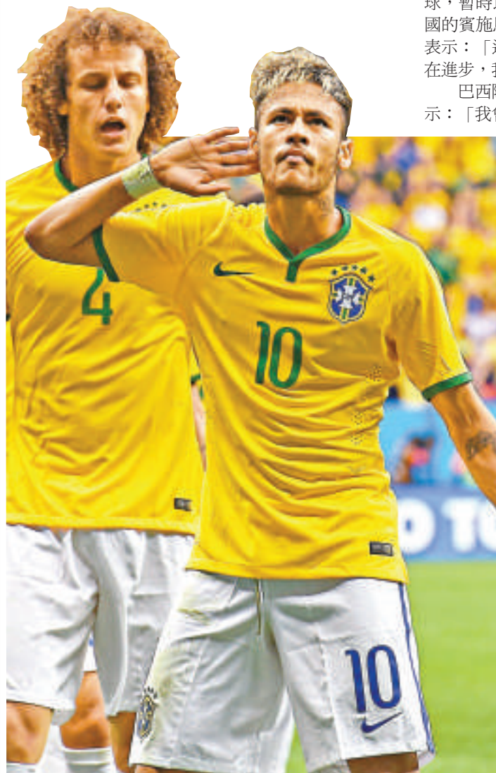
▼利萊費亞（左一）頭槌建功