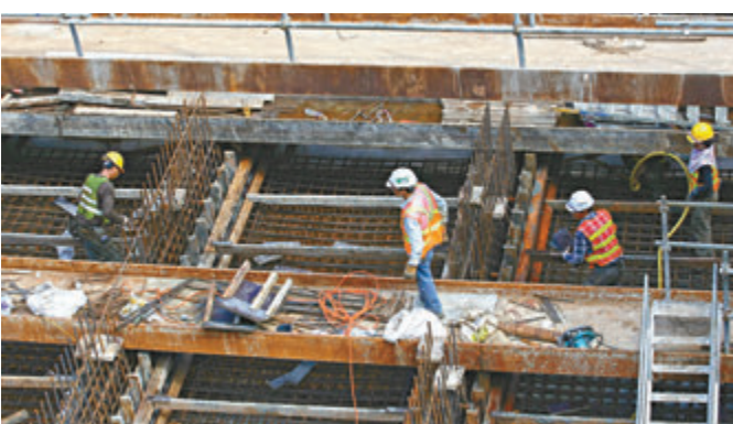
◀建造業青黃不接，期望調高薪酬吸引年輕人入行