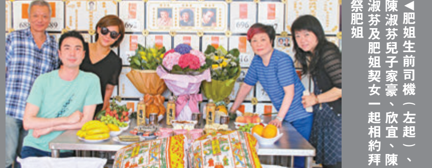
▲肥姐生前司機、陳淑芬及肥姐家豪(左起)、陳淑芬及肥姐家豪(左起)一起相約拜祭

最近她的身形再一次備受關注，她謂換轉以前，她會崩潰，因為這樣會令肥姐不開心，會令關心她的人失望，但現在不同了，「我想告訴所有人，你要做回自己，令自己最快樂，要令自己最健康，現在我開始展開我新的人生，什麼都不會再擊倒我，因為我清楚了自己，我重新再一次認識自己。如果你人生有什麼問題，請看看我，我都可以撐過來，你都一定可以!請不要將自己快樂放在你的身形上。大家一起加油!」