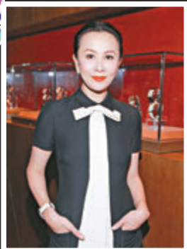
▲嘉玲直為演舞台劇，令她壓力爆煲