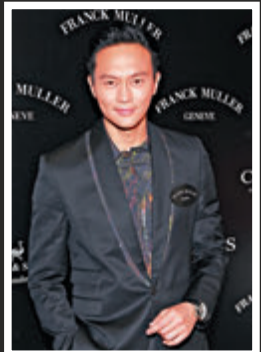
▲Chilam自爆送百萬名表給太太親觀