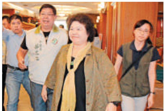
▲高雄市長陳菊（右二）28日表示，激烈示威並非台灣人的待客之道

【大公報訊】綜合中新社及新華社台北二十八日消息：對國台辦主任張志軍的座車昨天在高雄市遭抗議人士潑漆一事，中央社28日援引高雄市長陳菊的話說，這並非台待客的待客之道。