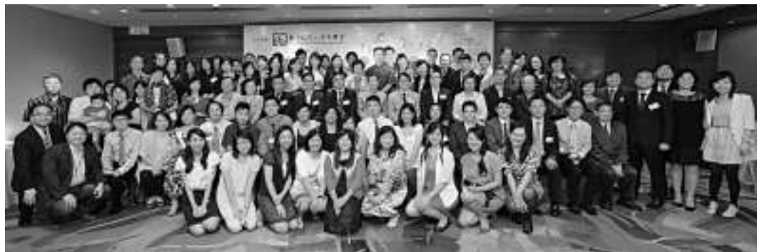
▼得獎優秀教師與到場支持的校長、親友大合照

立了「優秀教師網絡」，期望透過凝聚歷屆優秀教師，互相分享良好的教學經驗及成果，共同推動各學科的發展。為迎接10周年的來臨，教聯會舉辦了多場活動，包括舉行13場專業發展講座，