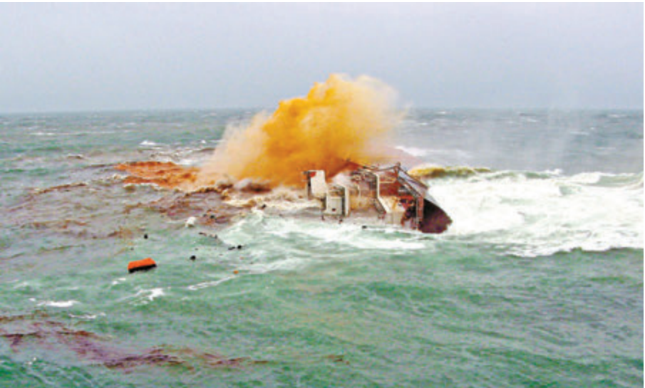
◀兩名飛行服務隊隊員去年在颶風尤特襲港時拯救沉船船員獲頒銀英勇勳章，圖為廣東海事局向飛行服務隊致送牌匾 資料圖片

許，而金紫荊星章則有11位得主，當中包括終審法院非常任法官司徒敬、賀輔明、財經事務及庫務局常任秘書長區璟智、觀塘區議會主席陳振彬、香港廣東社團總會主席王國強、全國政協常委洪祖杭、關愛基金專責小組主席羅致光、全國政協委員蔡冠深、前運輸及房屋局常任秘書長柏志高、前民政事務局常任秘書長楊立門，以及香港房屋協會主席