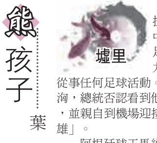
熊孩子 墟里 葉歌

巴西世界杯足球賽，烏拉圭前鋒蘇亞雷斯在小组赛咬意大利对手，被國際足聯(FIFA)處罰，停賽九場國際賽事，四個月不得從事任何足球活動。消息傳出，烏拉圭民情洶湧，總統否認看到他咬人，抗議FIFA處罰太重，並親自到機場迎接這位鏖戰而歸的「足球英雄」。 阿根廷球王馬納富拿認為，蘇亞雷斯此舉沒有造成嚴重傷害，大家盡可一笑置之，視其為足球文化的一部分。烏拉圭總統聽來更像護短的父親，辯護道：球星出身赤貧，沒受過大學教育，是在球場上跌打滾爬長大的。言下之意，我們不該用普通認可、遵守的足球規則和運動道德來約束這個苦孩子。 由此想到前幾日到我家來做客的「熊孩子」。她從小到大一直淘氣，小時候還能說不少不更事，如今已是花季少女，來做客依然手腳不停，翻箱倒櫃，胡言亂語。她的父母對孩子的任何不規矩都能接受，將她所有粗魯無禮的言行都解讀為聰穎、可愛。再看他們夫妻，居然也坐沒坐相，吃沒吃相，無視他人觀感。 養不教，父之過。父母持身不正，孩子必有甚之。護短或出於愛心，但如父母不能防微杜漸，孩子的行為越發放縱，日後可能鑄成大錯。像蘇亞雷斯，聽說早有前科，世界杯前就曾被咬過兩三次了。此時不罰，難道等他真的造成重大傷害再來亡羊補牢？ 有時，明星犯大錯，就是被大眾寵壞了。