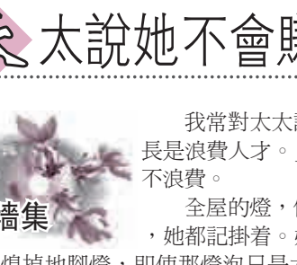
紐約抒懷 紐約 抒懷

「唐宋八家」一指的是唐朝的韓愈、柳宗元、歐陽修、蘇軾、蘇轍、蘇洵、王安石、蘇軾、蘇轍、蘇洵、王安石。 「唐宋八家」一指的是唐朝的韓愈、柳宗元、歐陽修、蘇軾、蘇轍、蘇洵、王安石、蘇軾、蘇轍、蘇洵、王安石。 「唐宋八家」一指的是唐朝的韓愈、柳宗元、歐陽修、蘇軾、蘇轍、蘇洵、王安石、蘇軾、蘇轍、蘇洵、王安石。