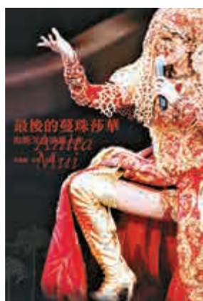
▲《最後的蔓珠莎華——梅艷芳的演藝人生》封面