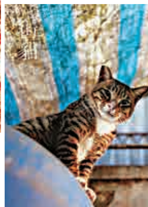
▶《街貓》以二百多幅相片展現香港街貓的生活狀況