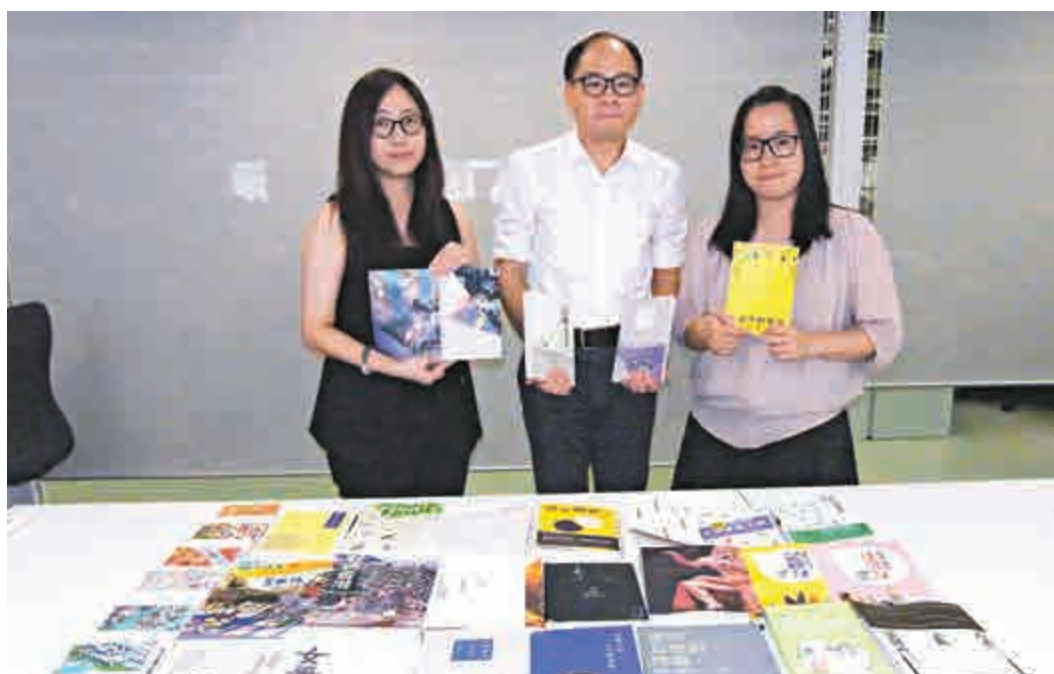
錄了五十種香港原生植物，讀後你會發現家門外的香港就是一個珍貴的植物教室。

《藏在古蹟裏的香港》是一本圖文並茂、解讀香港古蹟的通識參考書。《尋花——香港原生植物手札》收