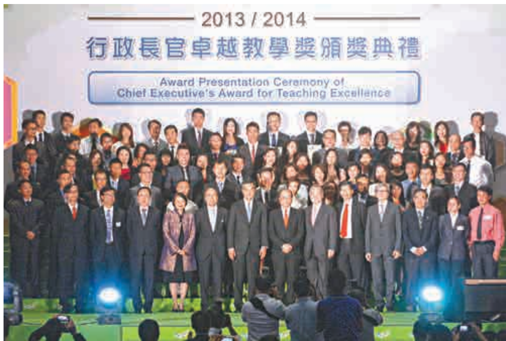
▲梁振英（前排左六）及其他主禮嘉賓與獲獎教師合照

行政長官卓越教學獎督導委員會主席黃鎮南介紹，教學獎下一輪評選活動將於7月14日展開，包括「中文科」、「英文科」和「德育及國民教育科」，歡迎老師參加。出席本屆頒獎禮的主禮嘉賓還有教育局局長吳克儉、教育局常任秘書長謝凌潔貞、教育統籌委員會主席鄭慕智、課程發展議會主席楊綱凱等。