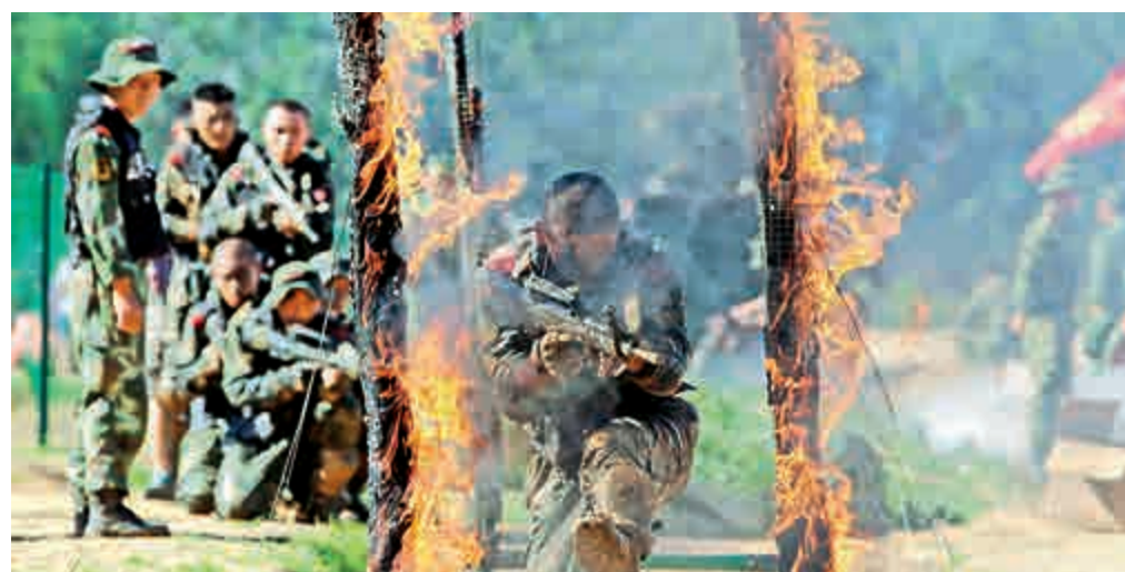
▲11日，北京順義某訓練基地，武警北京市總隊某部特戰隊預備隊員進行穿越火障訓練

針對11月即將在北京舉行的APEC會議，傅政華表示，北京警方將面臨重大考驗。目前，警方已完成總體