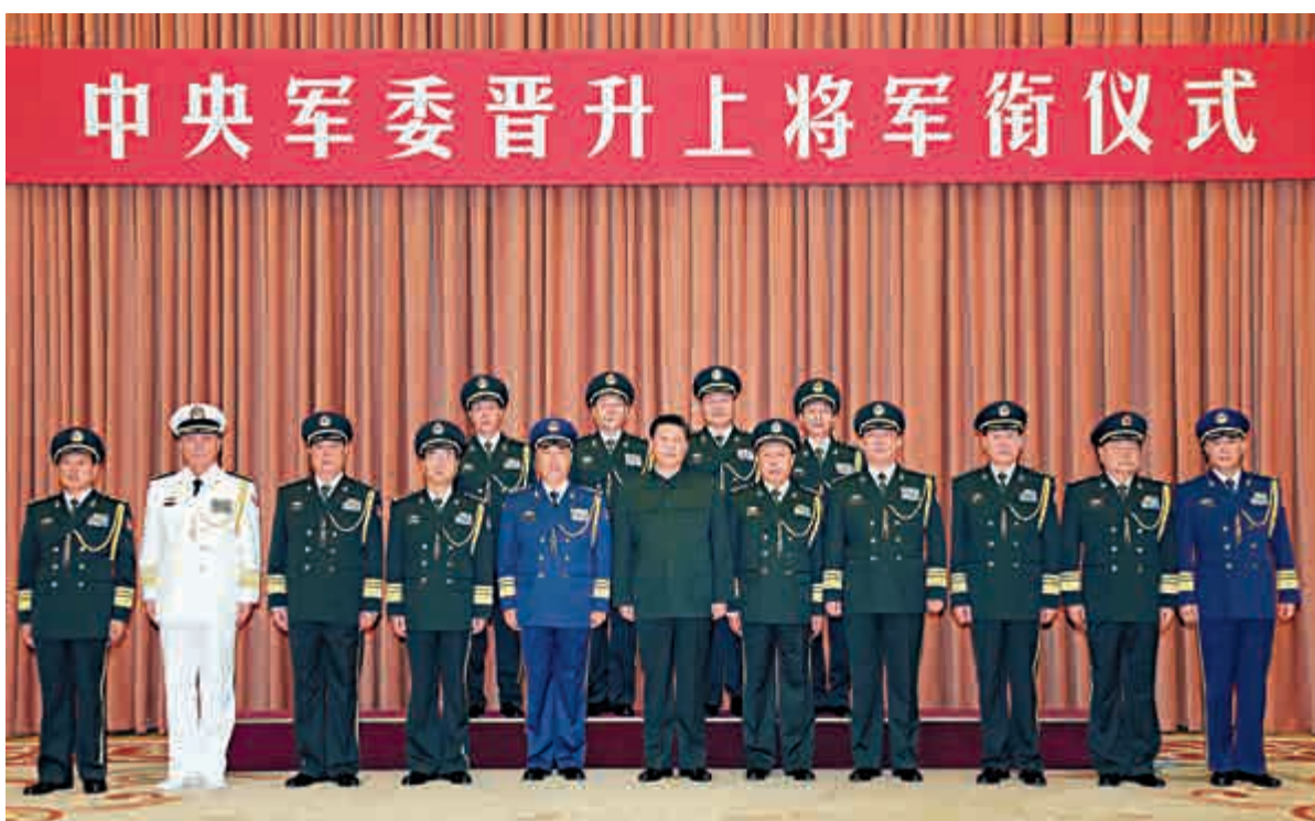
▲11日，中央軍委在北京八一大樓舉行晉升上將軍銜儀式，儀式結束後中央軍委主席習近平等人同晉升上將軍銜的軍官合影留念。新晉升的4位上將分別是瀋陽軍區政委褚益民、副總參謀長戚建國、瀋陽軍區司令員王教成、廣州軍區政委魏亮

從年齡上看，戚建國與王教成均為1952年生人，褚益民與魏亮均為1953年生人。4人都是十八屆中央委員，也都擔任過集團軍主官。