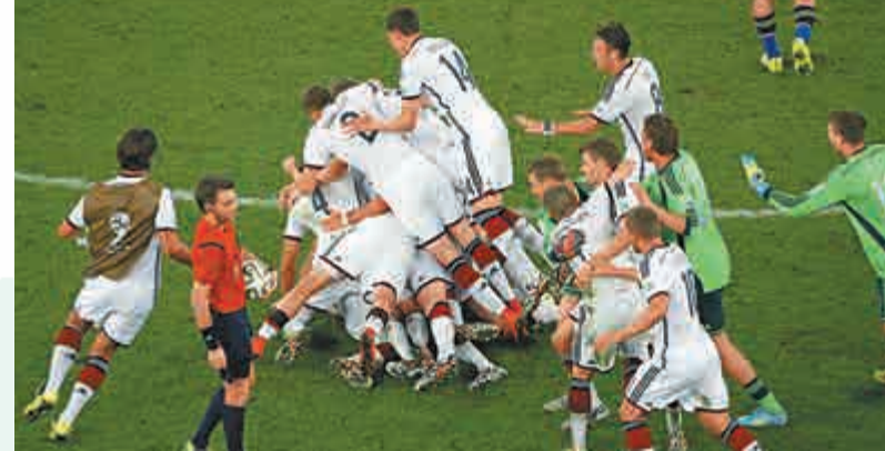
▲完場一刻，德國球員於場內相擁慶祝