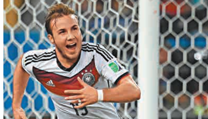
▲馬里奧葛斯攻入致勝球，成功揚名立萬