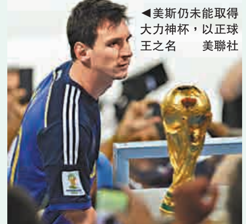
▲美斯仍未能取得大力神杯，以正球王之名

路維更將其豪華陣容歸功於前教練奇連士文，他說：「我們用了10年時間去享受現時所得的喜悅，他(奇連士文)於2004年接手後改變了很多。」