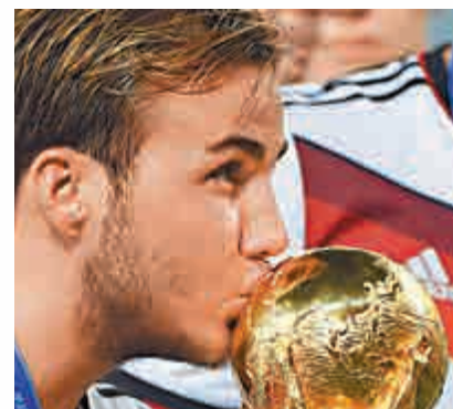
▲馬里奧葛斯親吻冠軍寶座