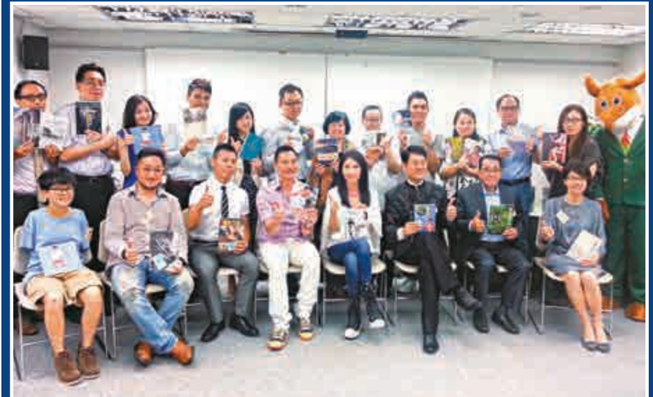
▲參展商及作家合影