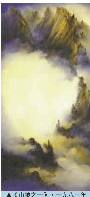
▲《山懷之一》，一九八三年