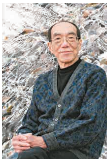
▲王無邪在香港畫壇具有威望，於二〇〇七年獲頒銅紫荊星章（BBS）