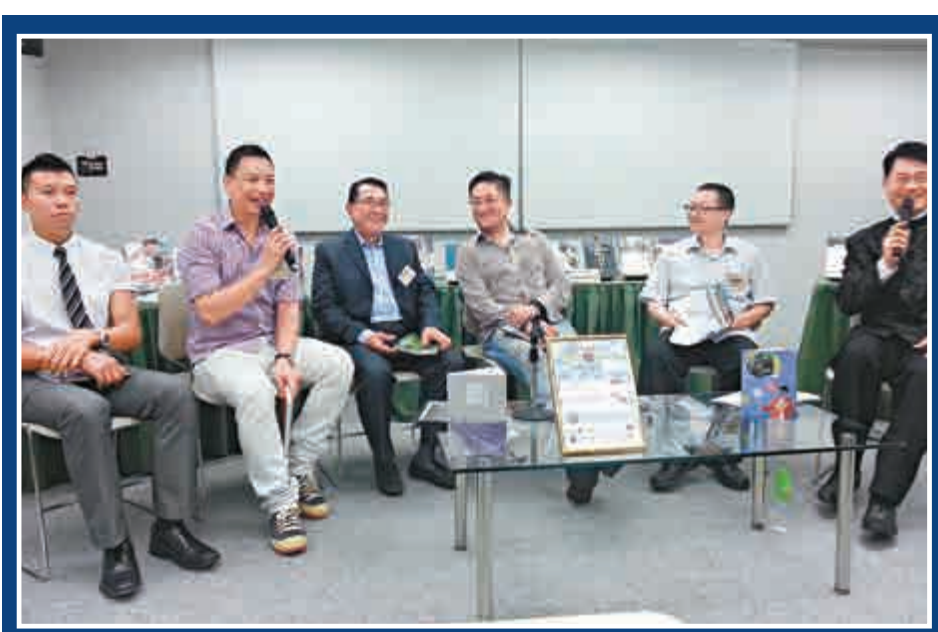
▲「飲食男女」的作者及出版商介紹作品內容

今屆書展在夜書市推出特別優惠，凡於七月十八日至十九日晚上十時至午夜十二時，惠顧聯合出版集團任何攤位，在同一商號一次過購物折實滿五百，並出示當天入場門票，即可再減二十五元。詳情可瀏覽www.sup.com.hk。