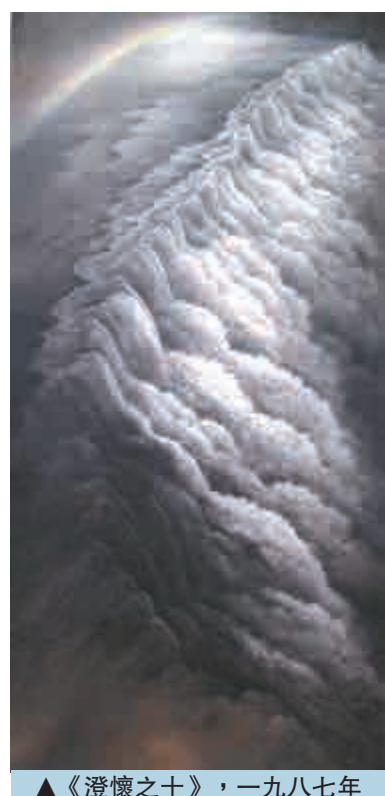
▲《澄懷之十》，一九八七年