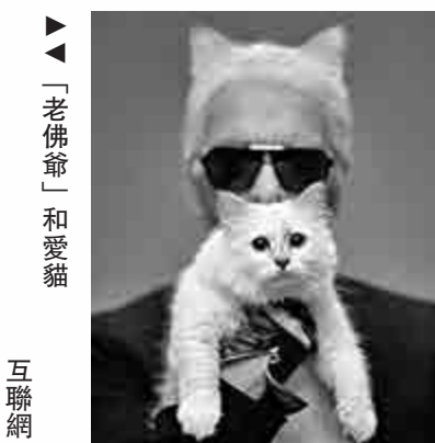
▶ 「老佛爺」和愛貓 互聯網