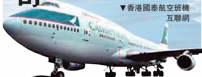
▼ 香港國泰航空班機 互聯網