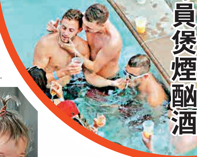
▼ 英格蘭球員煲煙酗酒照

去年10月，韋舒亞被拍到在夜蒲時吸煙，遭雲格教訓，指韋舒亞在破壞自己的身體及形象：「作為足球員，一定要注重保養身體，同時亦要注意在公眾地方的行為，會否影響形象。」