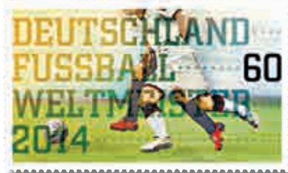
▲ 德國世杯冠軍紀念郵票 《華爾街日報》

【大公報訊】據《華爾街日報》15日消息：剛捧得大力神杯的德國，發行了一款紀念世杯勝利的郵票，其中500萬紀念郵票甚至在決賽舉行前已印好，透露出了德國在賽前就已對奪冠充滿信心。