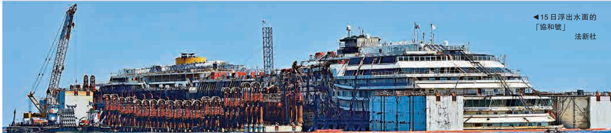
◀ 15日浮出水面的「協和號」