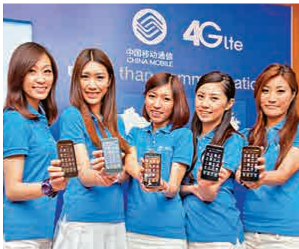
▲中移動4G上客量突破一千萬戶

近日，多家媒體報道指，國資委已給中移動、中電信及聯通下發通知，要求三大運營商在3年內連續削減營銷費用，降幅達20%。三大運營商年報顯示，去年中電信、中移動、聯通銷售費用超過2000億元。