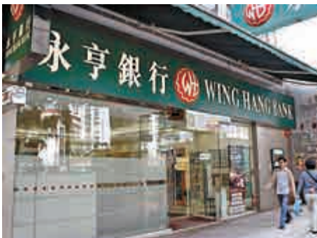
◀永亨與華銀昨日發出通告，指不會提高要約價

對於美資對沖基金Elliott Capital增持永亨（00302）股份至7.8%，或令華銀銀行私有化永亨出現變數一事，永亨與華銀昨日發出通告，指不會提高要約價，要約價將維持在每股永亨銀行股份125元。早前華銀銀行行政總裁錢乃驥表示，早知Elliott Capital的存在，指不會因此改變其全購的計劃。他又稱，取得永亨逾50%控股權，已十分重要，若未能購得90%股份，將維持永亨上市地位。事實上，早有券商指，若華銀私有化永亨失敗，永亨復牌後的股價將大跌四成。