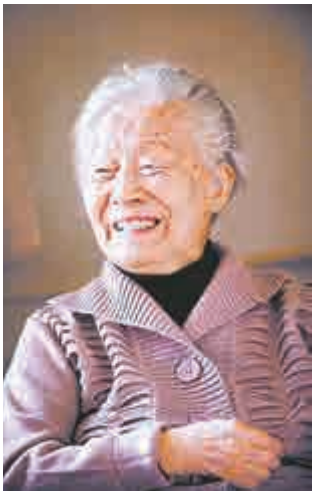
▲著名翻譯家、文學家楊絳103歲

據北京《法制晚報》報道，17日是著名翻譯家、文學家楊絳（國學大師錢鍾書夫人）先生103歲的生日，為了不被來訪者打擾，老人提前一周便住進醫院躲清靜。