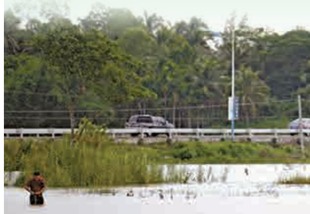
▲海南瓊海市嘉積鎮的村民走在被水淹沒的田埂上