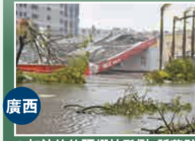
▲加油站的頂棚被颶倒