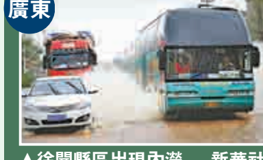
▲徐聞縣區出現內湧

【大公報訊】綜合新華社十九日消息：18日下午至19日早晨，超強颱風「威馬遜」先後在中國海南、廣東、廣西三省區三次登陸，截至目前，已造成至少17人死亡，多地遭受重創。