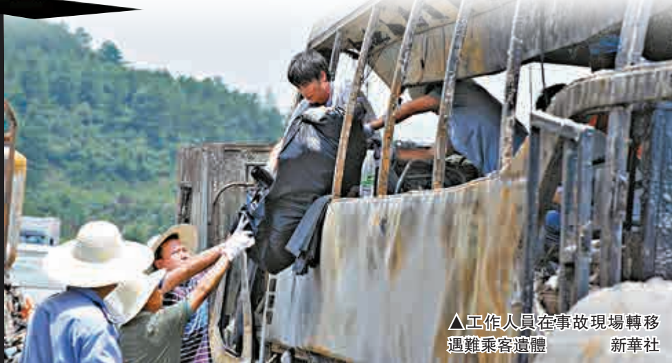
▲工作人員在事故現場轉移遇難乘客遺體