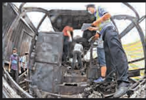
▲工作人員在事故現場進行清理核實工作