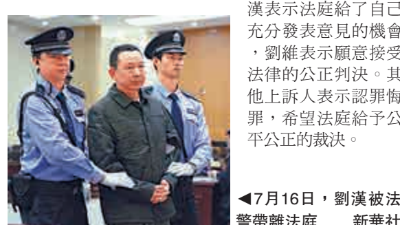
◀7月16日，劉漢被法警帶離法庭

在劉維等上訴案的庭審中，檢察員圍繞劉維等人組織、領導、參加黑社會性質組織及刑罰情節的事實出示了新證據，劉維等有關上訴人及其辯護人、檢察員分別發表了質證意見。法庭還就量刑事實進行了法庭調查。法庭辯論結束後，劉漢、劉維等作了最後陳述。劉漢表示法庭給了自己充分發表意見的機會，劉維表示願意接受法律的公正判決。其他上訴人表示認罪悔罪，希望法庭給予公平公正的裁決。