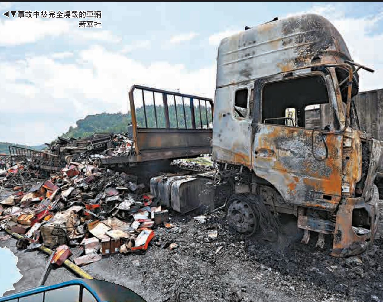
◀▼事故中被完全燒毀的車輛