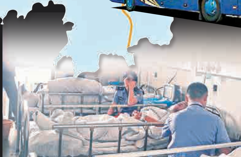
▲在邵陽市隆回縣人民醫院接受治療的傷員接受調查人員詢問