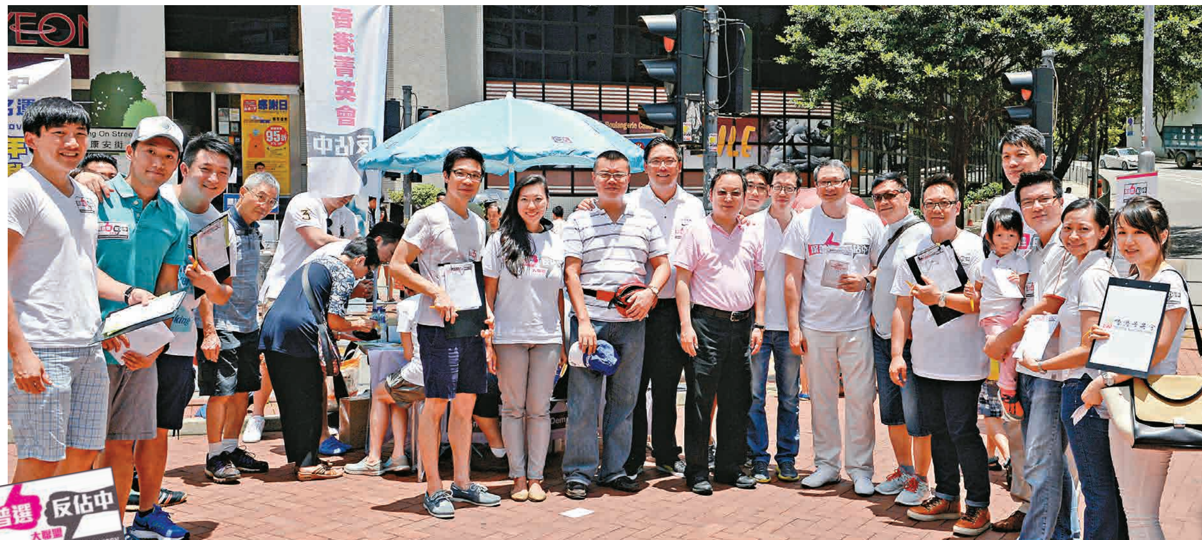
▲青英會在太古廣場設立反佔中簽名街站 本報記者林良堅攝