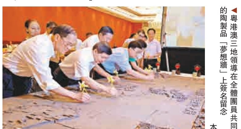
粵港澳三地領導在全體團員共同製作的陶製品「夢想牆」上簽名留念