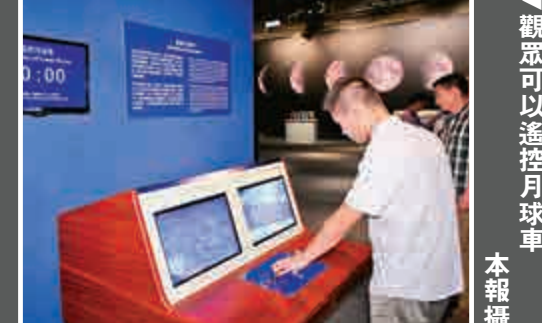
觀眾可以遙控月球車