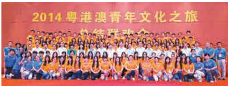
▲「粵港澳青年文化之旅」全體團員合影