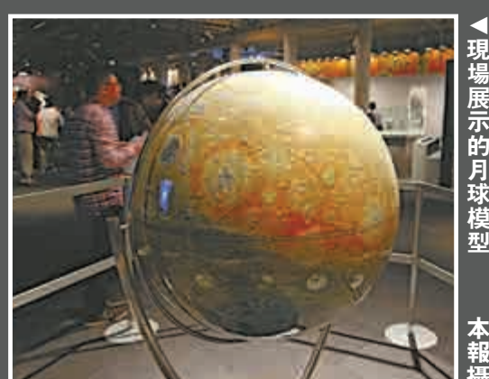
現場展示的月球模型

編者按：「九天攬月——中國探月工程展」展期：七月二十一日至八月二十四日。地點：尖東科學館道二號香港科學館地下展廳，免費開放，查詢電話：二七三二二二二二。