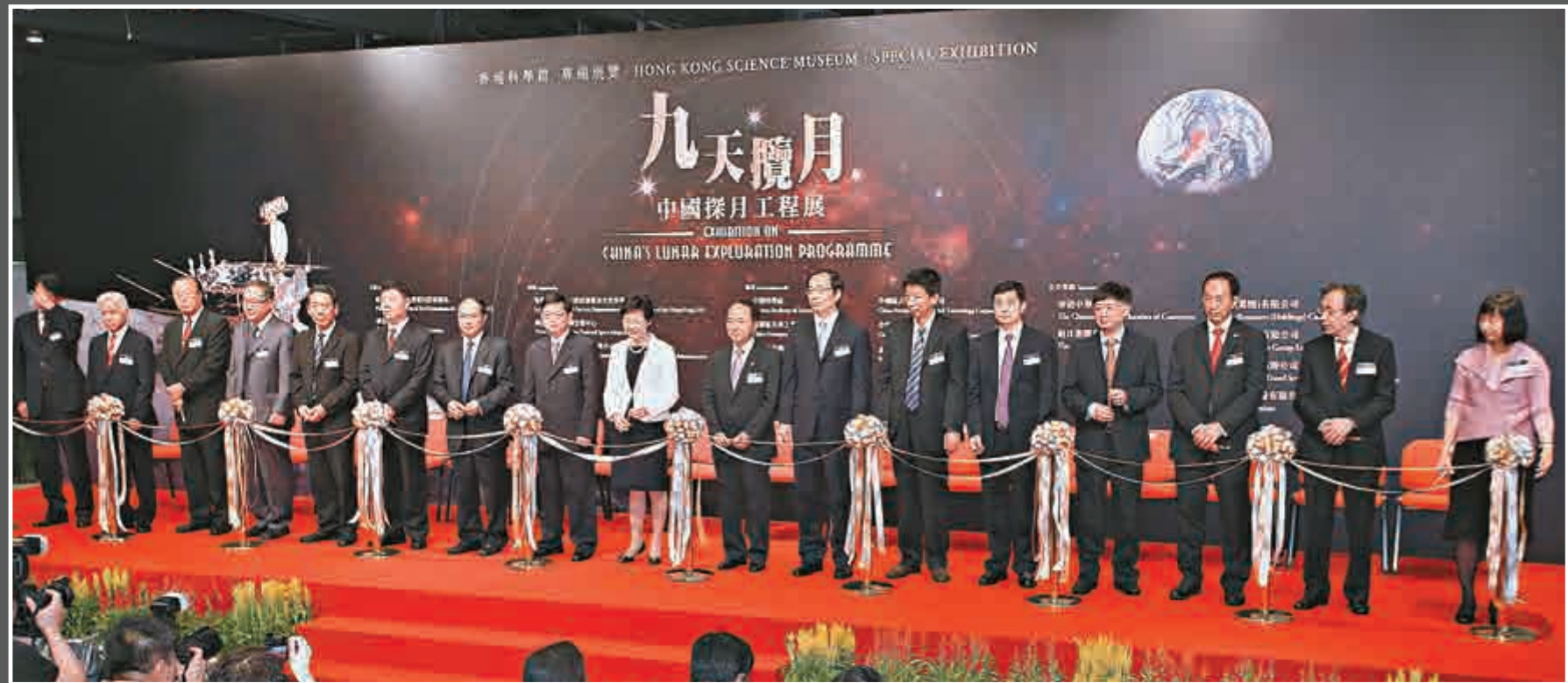
▲出席開幕禮嘉賓合影