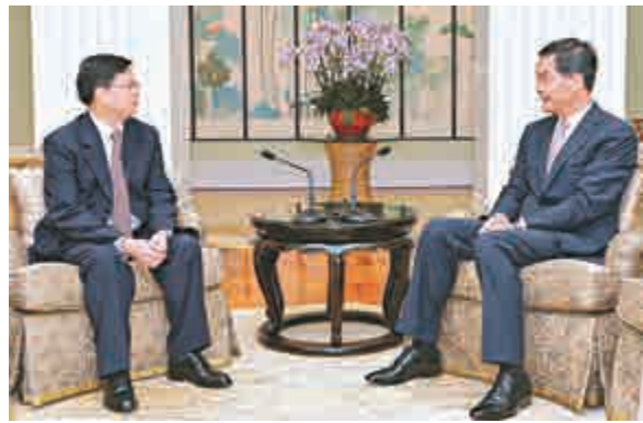
▲行政長官梁振英（右）昨日下午在禮賓府與訪港的國家航天局副局長張建華會面