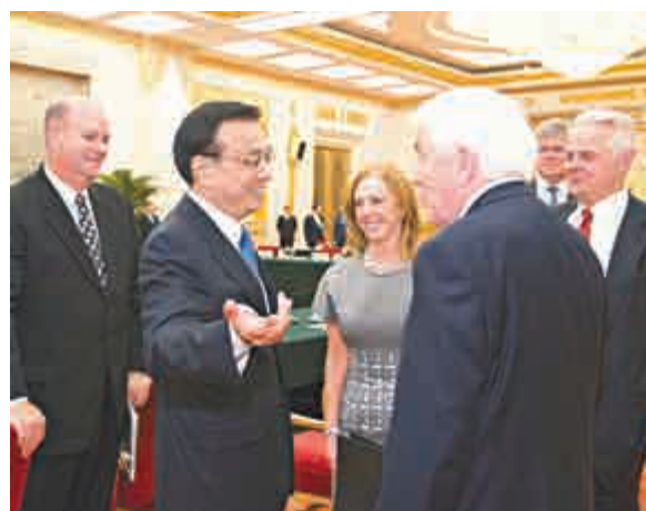
▲22日，國務院總理李克強在北京人民大會堂與美國工商領袖親切交談

【大公報訊】中新社北京二十二日消息：中國國務院總理李克強22日下午在北京人民大會堂會見出席第六輪中美工商領袖和前高官對話的美方代表並座談。李克強指出，良好的中美關係是中美創造更大全球化利益的空間所在。雙方要堅持相互尊重、平等相待，在增強互信、深化合作、拓展利益、管控分歧上多下功夫。