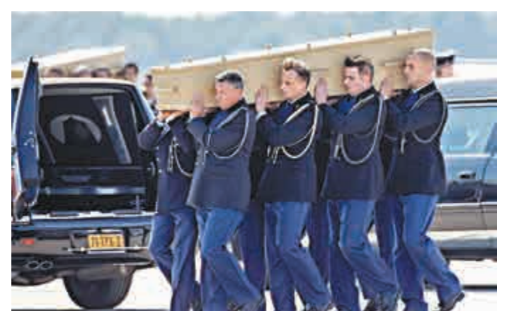
▲馬航MH17客機乘客遺體23日抵達埃因霍溫機場

24小時下載，下載後的資料將送交國際調查人員分析。另有美國媒體指出，在烏東墜毀現場，MH17客機的駕駛座艙，遭柴油電鋸鋸開，完整的機尾也顯然被侵入。國際觀察員質疑，可提供失事證據的重要機身零件為何遭破壞。