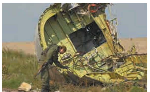
▲一名烏東民兵22日在墜機現場觸碰客機殘骸

美國情報官員說，俄羅斯為MH17航班遭導彈擊落「創造條件」，但是他們沒有提出俄政府直接涉及這項攻擊的證據。美國總統國家安全事務副助理羅茲周二也承認，美方沒發現俄羅斯與MH17墜毀間有直接聯繫。但他堅稱，「我們認為普京和俄羅斯政府負有責任，因為他們向分離分子提供了支持、武器和訓練，並幫助造成了烏克蘭東部的動盪局面。」