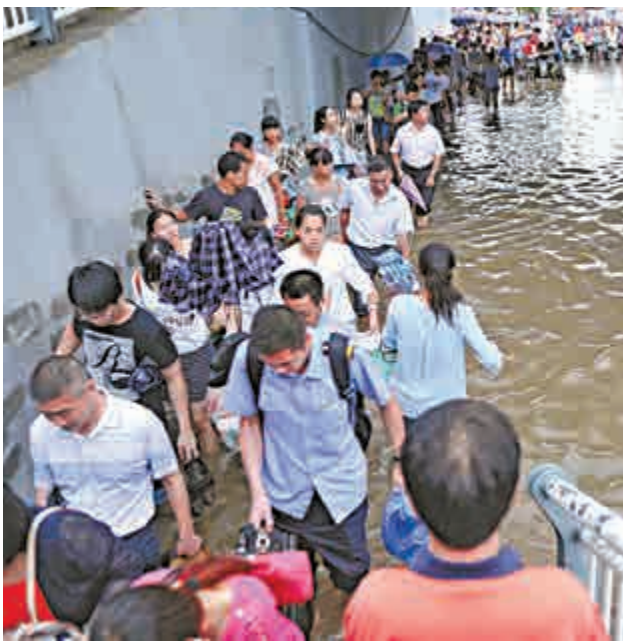
▲福州市區多處路段積水成災，市民出行受阻