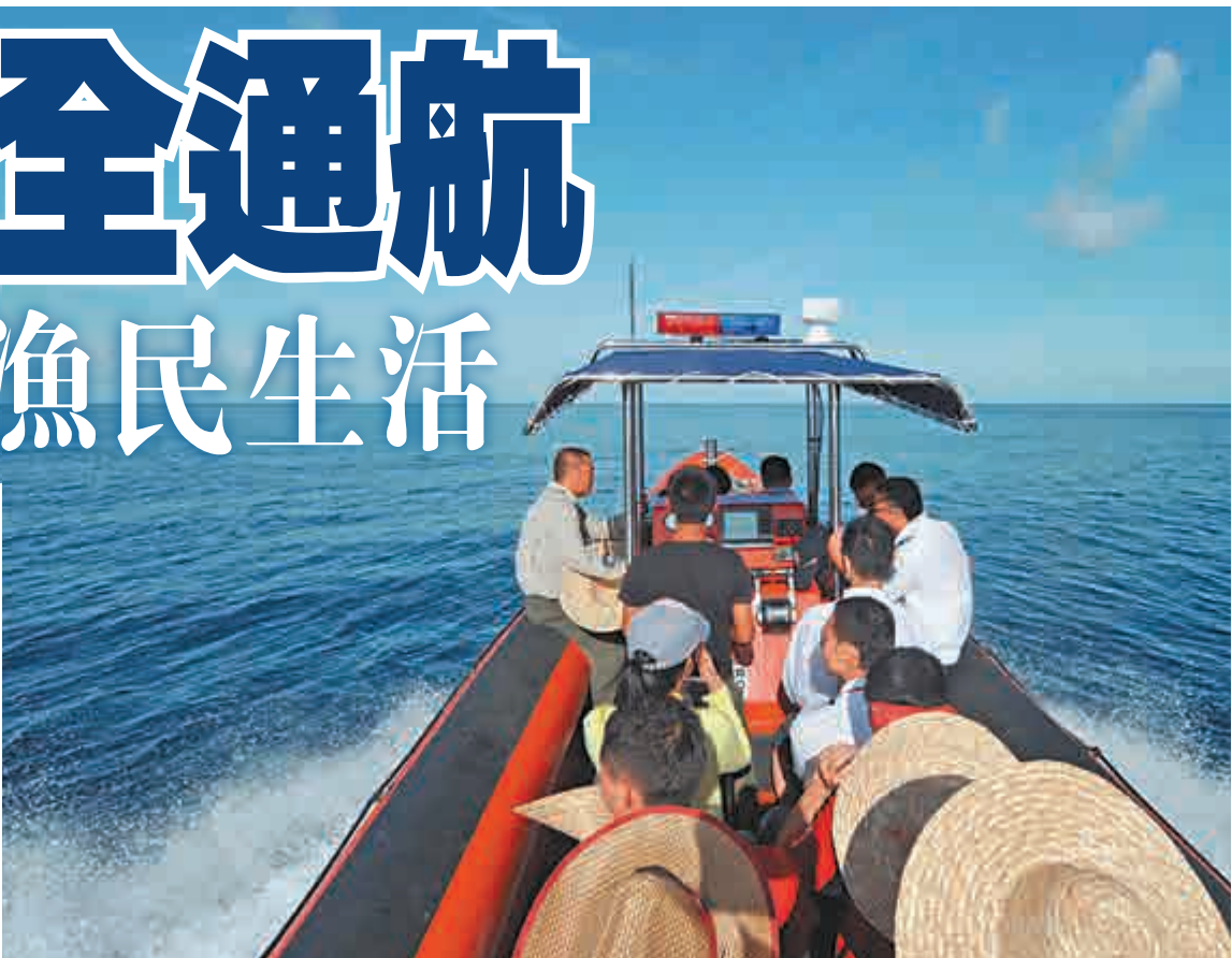
▲乘客乘坐交通快艇到達永樂群島的甘泉島

永興島作為三沙市政治、軍事、經濟、文化中心，變化可謂日新月异。目前永興島附近海域有一些大型的施工船，看上去就像是一個大工地。 據《環球時報》報道，經過填海造陸，原來2.13平方公里的永興島實際面積已達到2.6平方公里。現有機場跑道，即是填海造陸的成果，西漁碼頭也是通過填海建立起來的。 負責西漁碼頭生活給水管、消防管電力安裝的一名建設者表示，自三沙建市以來，目前永興島約有20個項目在建，包括填海擴建機場，軍用和民用碼頭等。目前島上公路設施比較完善，已建成北京路、海南路、宣德路、永興路、永樂路5條主要道路，部分路段仍在擴建中。 兩年來，三沙市的各項基礎設施有了極大的改善，嶄新的市人民醫院已經建成，中國移動、中國電信和中國聯通的手機信號已覆蓋永興島、琛航島等島嶼及其附近海域。