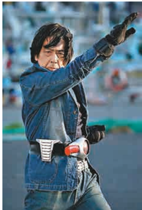
▶《平成對昭和》找回當年飾演本鄉猛的藤岡弘演出