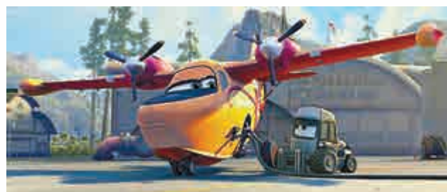
▲以小朋友為對象的迪士尼動畫片《飛機總動員2》