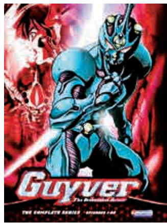
◀新一代幪面超人的設定，不禁令人想起《強殖裝甲》