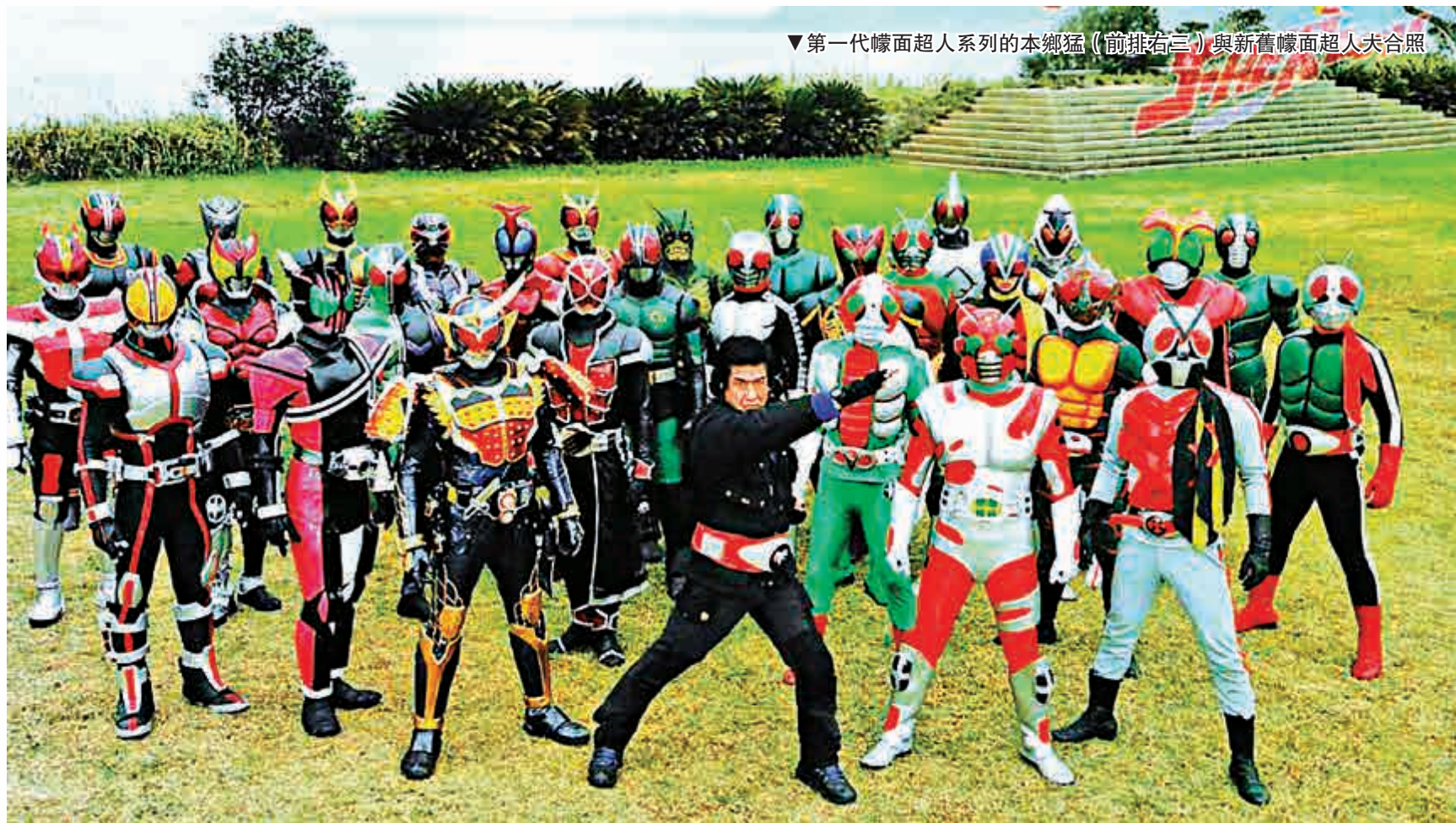
▼第一代幪面超人系列的本鄉猛（前排右三）與新舊幪面超人夫合照