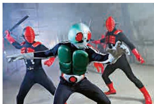
▲幪面超人的特攝劇集和電影經歷四十三年，仍具吸引力