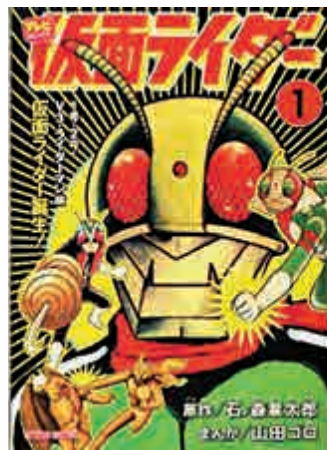
◀石森章太郎的漫畫原著《幪面超人》

或許，對於日本以至港台等多年來有播放幪面超人劇集的觀眾來說，這部《平成對昭和幪面超人大戰》最讓大家感動的地方是找來了當年扮演本鄉猛和神敬介等早期主角的演員重出江湖，演回原來的角色。在這一點上，日本電影人就像是荷里活行家那樣，流行老人家的回歸。除了幪面超人，也有老人版的鹹蛋超人、七星俠等做主角的電影推出。而因為特攝片的科技性質，所有的平行時空、穿越等的題材都可以出現，於是新舊各種不同年代的特攝角色可以很方便的同場出現，讓新觀眾可以看到人頭湧湧的熱鬧場面，老觀眾可以開開心心地懷舊一番也就夠了。或許，這就是《平成對昭和》在日本票房成功的原因。