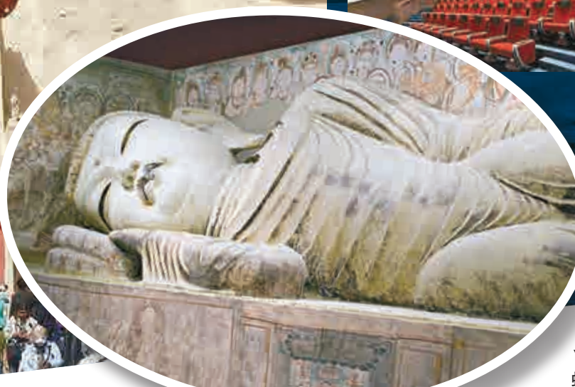
▲敦煌莫高窟第158窟內著名的涅槃大佛 網絡圖片