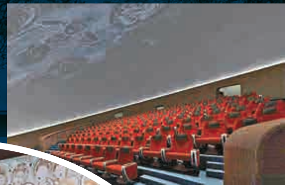
▲球幕電影

球幕電影，又稱「圓穹電影」，拍攝及放映均採用超廣角魚眼鏡頭，觀眾廳為圓頂式結構，銀幕呈半球形，觀眾被包圍其中，視銀幕如同穹穹。由於銀幕影像大而清晰，且伴有立體聲環音，使觀眾如置身其間，臨場效果十分強烈。