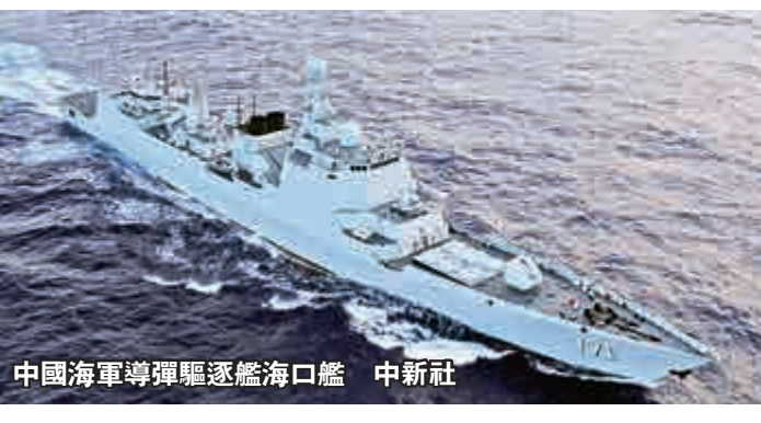
中國海軍導彈驅逐艦海口艦

【大公報訊】據新華社海口艦二十三日消息：「環太平洋-2014」演習的海上演習階段過半，各國艦艇在完成多項演習科目的同時，也吸引了各界媒體記者關注的目光。日前，中美記者分別對美國海軍皇家港號導彈巡洋艦與中國海軍導彈驅逐艦海口艦進行了採訪。