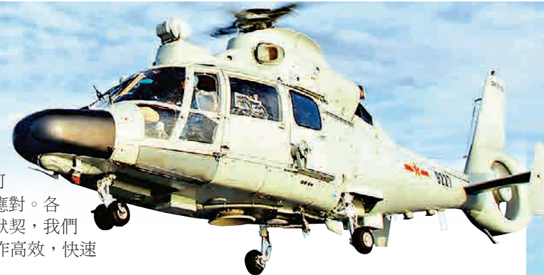
▲海口艦艦載直升機起飛

趙曉剛表示：「中國一直堅持走和平發展的道路，我們奉行的是防禦性的國防政策，我們一直堅持國防建設與經濟建設協調發展。對國家來說，建設一支與國家安全和發展利益相適應的鞏固國防和強大軍隊，是中國現代化建