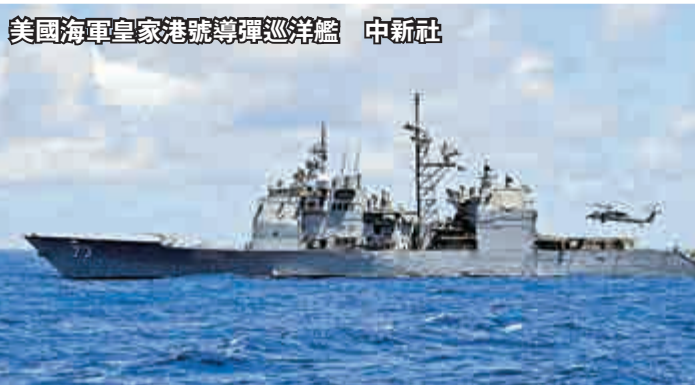
美國海軍皇家港號導彈巡洋艦