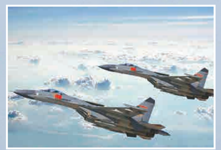
◀▲原武警部隊司令員巴中傑中將指出，中國軍隊應加強指揮和保障體制的改革，做好隨時打仗的各項準備。圖為解放軍陸海空三軍加強訓練 資料圖片