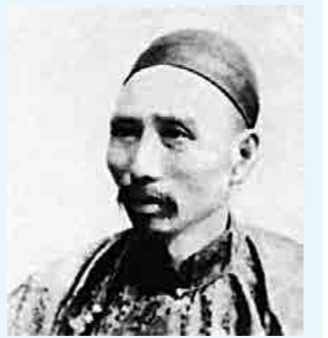
▲北洋水師提督丁汝昌

戰爭爆發前夜，北洋海軍再添一船一炮。姜鳴還引述清朝駐日外交官的記述，北洋海軍訪問日本時一方面看到日本海軍的興盛，一方面北洋官兵還一起出去嫖娼。另外，1895年7月20日，《馬關條約》簽訂3個月後，因臨陣脫逃被殺的「濟遠」艦管帶方伯謙的親屬，欲將方伯謙在劉公島上的60間房產和土地賣掉，「這就是我們所看到的一些用親戚、家屬的方式進行腐敗的非常重要的歷史案例。」