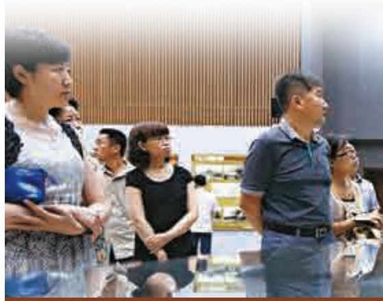
▲7月24日，「勿忘甲午」——紀念中日甲午戰爭爆發120周年檔案圖片展在遼寧省檔案館開展，吸引了許多民眾前來觀看

「殤思·鏡鑒——甲午戰爭120周年研討會」由參考消息報社、新華社解放軍分社攜手中國政策科學研究會國家安全政策委員會、中國國家圖書館、上海世紀出版集團、中國史學會共同舉辦。